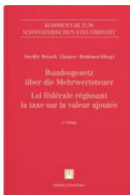
Bundesgesetz über die Mehrwertsteuer (MWSTG)/Loi fédérale régissant la taxe sur la valeur ajoutée (LTVA) Ladenpreis: 526,00EUR