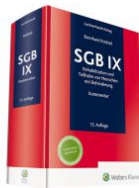
SGB IX Kommentar Ladenpreis: 153,20EUR