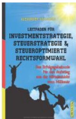
Leitfaden für Investmentstrategie, Steuerstrategie & steueroptimierte Rechtsformwahl Ladenpreis: 34,90EUR