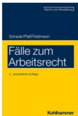
Fälle zum Arbeitsrecht Ladenpreis: 25,70EUR