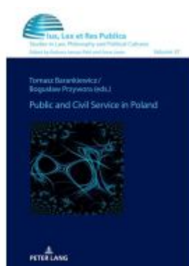
Public and Civil Service in Poland Ladenpreis: 51,40EUR