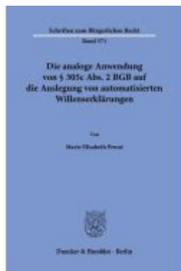
Die analoge Anwendung von § 305c Abs. 2 BGB auf die Auslegung von automatisierten Willenserklärungen. Ladenpreis: 71,90EUR