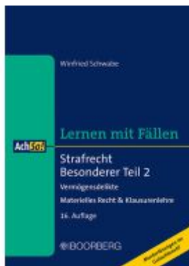
Strafrecht Besonderer Teil 2 Ladenpreis: 23,20EUR