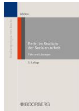
Recht im Studium der Sozialen Arbeit Ladenpreis: 25,50EUR