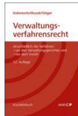
Grundriss des österreichischen Verwaltungsverfahrensrechts Ladenpreis: 72,00EUR