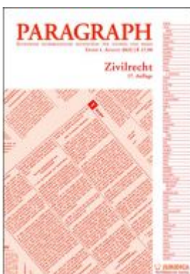
Paragraph - Zivilrecht Ladenpreis: 17,90EUR