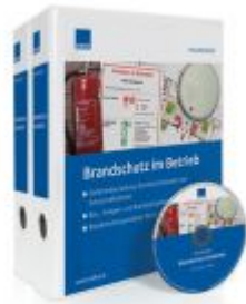
Brandschutz im Betrieb Ladenpreis: 207,90 EUR