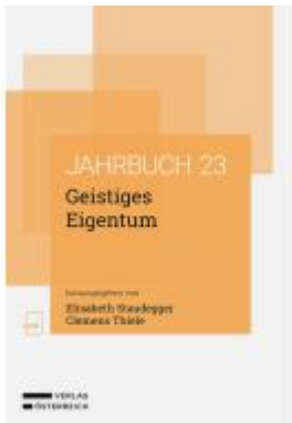
Geistiges Eigentum Ladenpreis: 78,00EUR