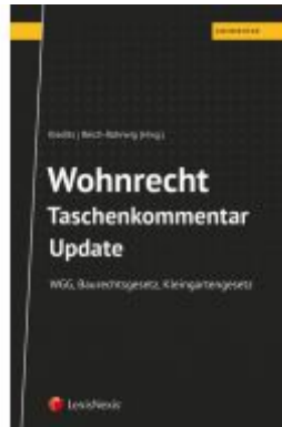
Wohnrecht Taschenkommentar - Update Ladenpreis: 49,00 EUR