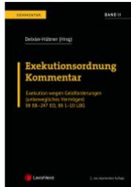
Exekutionsordnung - Kommentar Band 2 Ladenpreis: 214,00EUR