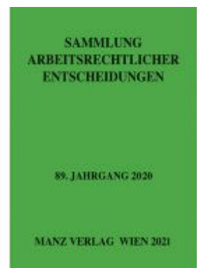
Sammlung arbeitsrechtlicher Entscheidungen Ladenpreis: 96,00EUR