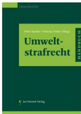
Handbuch Umweltstrafrecht Ladenpreis: 69,90EUR