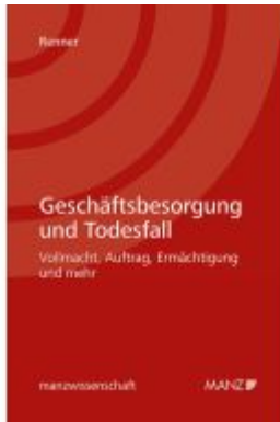
Geschäftsbesorgung und Todesfall Ladenpreis: 59,00EUR