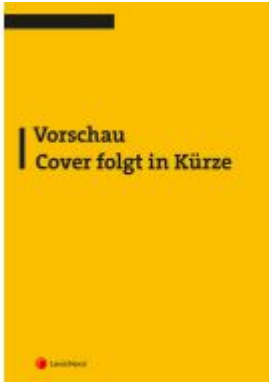
Bürgerliches Recht - graphisch dargestellt (Skriptum) Ladenpreis: 25,00 EUR