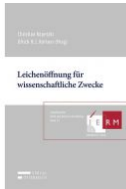
Leichenöffnung für wissenschaftliche Zwecke Ladenpreis: 58,00 EUR