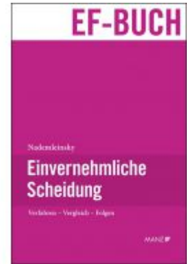
Einvernehmliche Scheidung Ladenpreis: 69,00 EUR