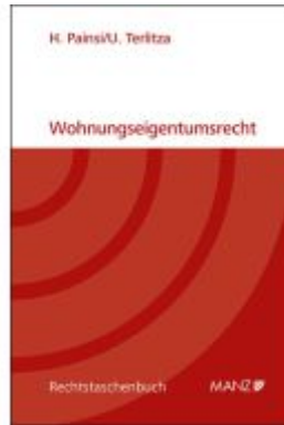
Wohnungseigentumsrecht Ladenpreis: 36,00EUR