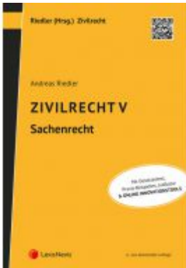
Zivilrecht V - Sachenrecht Ladenpreis: 50,00EUR