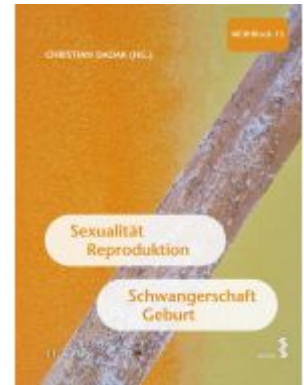
Sexualität, Reproduktion, Schwangerschaft, Geburt Ladenpreis: 27,90EUR