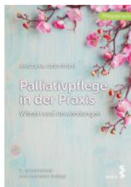
Palliativpflege in der Praxis Ladenpreis: 24,90EUR