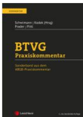
BTVG Praxiskommentar Ladenpreis: 59,00EUR