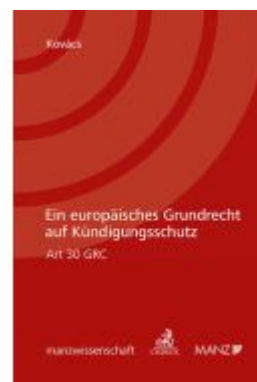
Ein europäisches Grundrecht auf Kündigungsschutz Art 30 GRC Ladenpreis: 128,00EUR