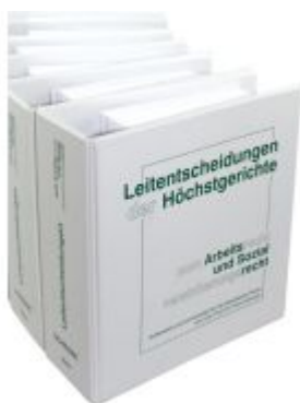
Leitentscheidungen der Höchstgerichte zum Arbeitsrecht und Sozialversicherungsrecht Ladenpreis: 1.360,00EUR