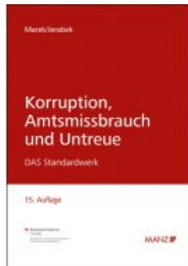
Korruption, Amtsmissbrauch und Untreue Ladenpreis: 42,00EUR