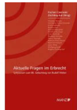
Aktuelle Fragen im Erbrecht Symposium zum 80. Geburtstag von Rudolf Weiser Ladenpreis: 34,80 EUR