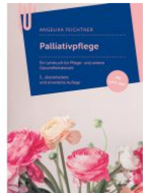
Palliativpflege Ladenpreis: 28,90 EUR