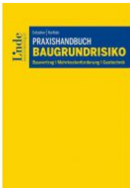
Praxishandbuch Baugrundrisiko Ladenpreis: 44,00EUR

Wir haben andere Produkte gefunden, die Ihnen gefallen könnten!