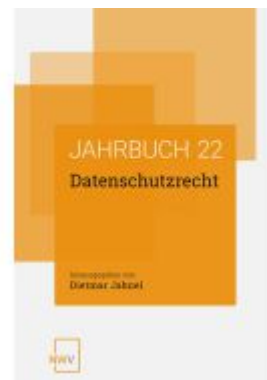
Datenschutzrecht Ladenpreis: 64,00EUR