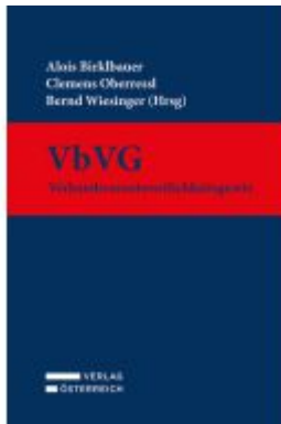
VbVG - Verbandsverantwortlichkeitsgesetz Ladenpreis: 169,00EUR