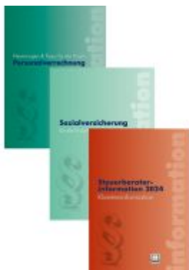
Steuerrechts-Paket 2024 Ladenpreis: 126,50EUR