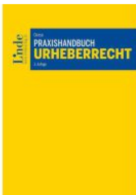
Praxishandbuch Urheberrecht Ladenpreis: 78,00EUR

Wir haben andere Produkte gefunden, die Ihnen gefallen könnten!