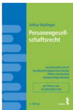
Personengesellschaftsrecht Ladenpreis: 28,00EUR