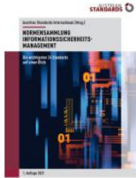
Normensammlung Informationssicherheitsmanagement Ladenpreis: 360,00EUR