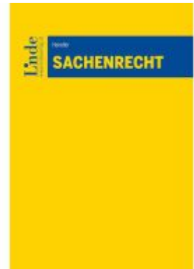
Sachenrecht Ladenpreis: 40,00EUR