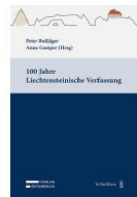
100 Jahre Liechtensteinische Verfassung Ladenpreis: 49,00EUR