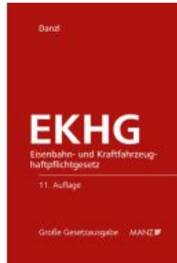
Eisenbahn- und Kraftfahrzeughaftpflichtgesetz EKHG Ladenpreis: 158,00EUR