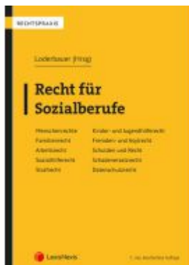
Recht für Sozialberufe Ladenpreis: 69,00EUR

Wir haben andere Produkte gefunden, die Ihnen gefallen könnten!