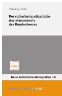
Der sicherheitspolizeiliche Assistenzinsatz des Bundesheeres Ladenpreis: 68,00EUR