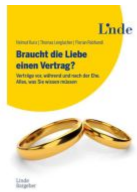
Braucht die Liebe einen Vertrag? Ladenpreis: 29,90EUR