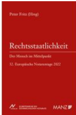
Rechtsstaatlichkeit - Der Mensch im Mittelpunkt Ladenpreis: 22,80EUR