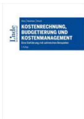
Kostenrechnung, Budgetierung und Kostenmanagement Ladenpreis: 72,00EUR