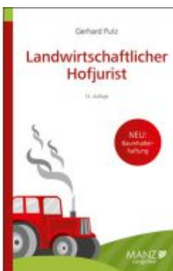
Landwirtschaftlicher Hofjurist Ladenpreis: 26,80EUR