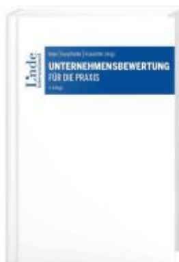
Unternehmensbewertung für die Praxis Ladenpreis: 109,00EUR