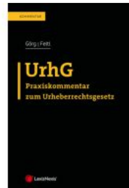
UrhG Ladenpreis: 124,00EUR