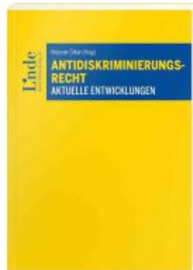
Antidiskriminierungsrecht Ladenpreis: 38,00EUR