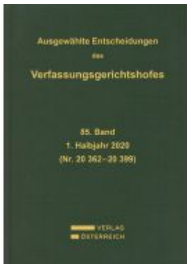
Ausgewählte Entscheidungen des Verfassungsgerichtshofes Ladenpreis: 259,00EUR

Wir haben andere Produkte gefunden, die Ihnen gefallen könnten!