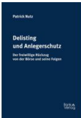
Delisting und Anlegerschutz Ladenpreis: 79,00EUR