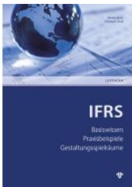
IFRS – International Financial Reporting Standards Ladenpreis: 24,20EUR