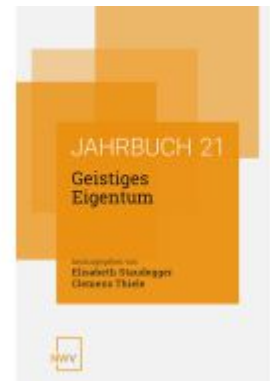
Geistiges Eigentum Ladenpreis: 68,00EUR