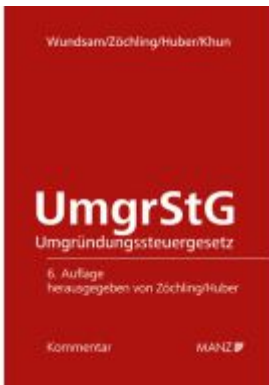
Umgründungssteuergesetz UmgrStG Ladenpreis: 178,00EUR