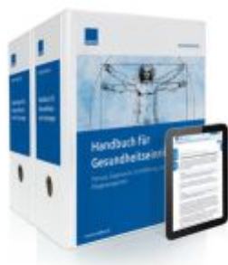
Handbuch für Gesundheitseinrichtungen Ladenpreis: 239,80EUR