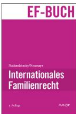
Internationales Familienrecht Ladenpreis: 94,00EUR