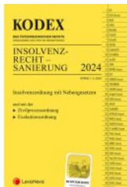
KODEX Insolvenzrecht - Sanierung 2024 - inkl. App Ladenpreis: 37,00EUR