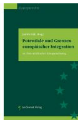
Potentiale und Grenzen europäischer Integration Ladenpreis: 85,00EUR