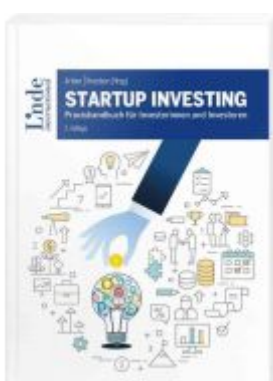
Startup Investing Ladenpreis: 44,00EUR