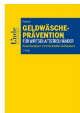
Geldwäscheprevention für Wirtschaftstreuhänder Ladenpreis: 34,00EUR