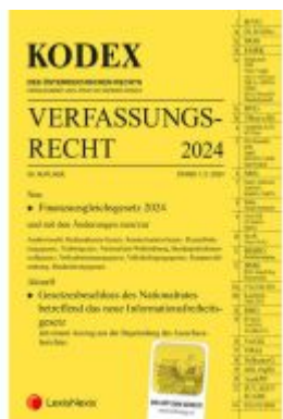
KODEX Verfassungsrecht 2024 - inkl. App Ladenpreis: 43,80EUR