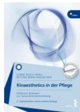
Kinaesthetics in der Pflege Ladenpreis: 32,90EUR