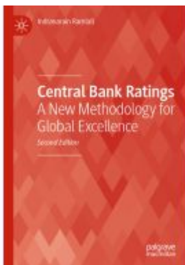
Central Bank Ratings Ladenpreis: 120,99EUR