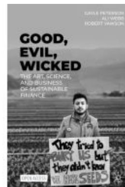
Good, Evil, Wicked Ladenpreis: 43,99EUR