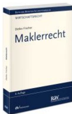
Maklerrecht Ladenpreis: 132,70EUR