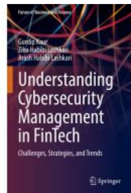
Understanding Cybersecurity Management in FinTech Ladenpreis: 65,99EUR