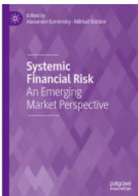
Systemic Financial Risk Ladenpreis: 175,99EUR