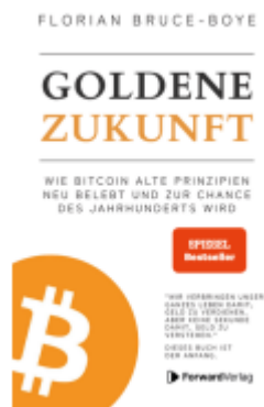
Goldene Zukunft Ladenpreis: 18,90EUR