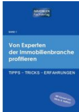
Von Experten der Immobilienbranche profitieren Ladenpreis: 20,60EUR