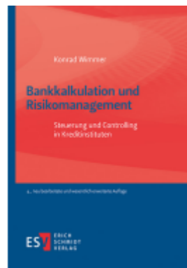
Bankkalkulation und Risikomanagement Ladenpreis: 91,50EUR