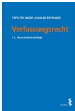
Verfassungsrecht Ladenpreis: 52,00EUR