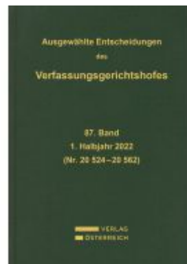
Ausgewählte Entscheidungen des Verfassungsgerichtshofes Ladenpreis: 459,00EUR