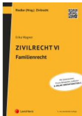
Zivilrecht VI - Familienrecht Ladenpreis: 37,00EUR