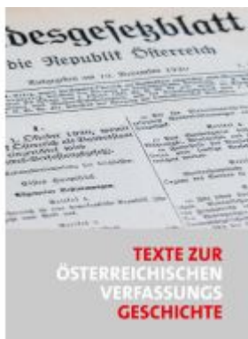
Texte zur österreichischen Verfassungsgeschichte Ladenpreis: 139,00EUR