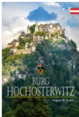
Burg Hochosterwitz Ladenpreis: 27,00EUR

Wir haben andere Produkte gefunden, die Ihnen gefallen könnten!