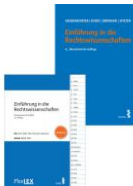
Kombipaket Einführung in die Rechtswissenschaften und FlexLex Einführung in die Rechtswissenschaften | Studium Ladenpreis: 36,00EUR