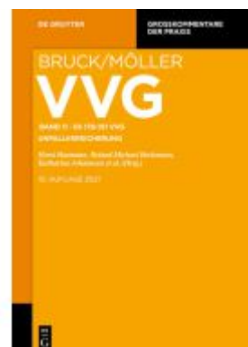
VVG / §§ 178-191 VVG Ladenpreis: 379,00EUR