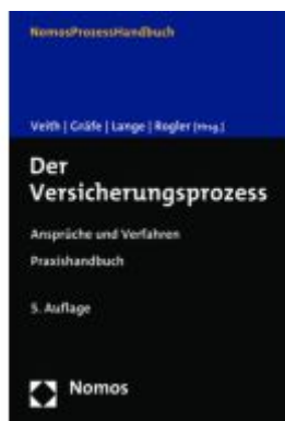
Der Versicherungsprozess Ladenpreis: 163,50EUR