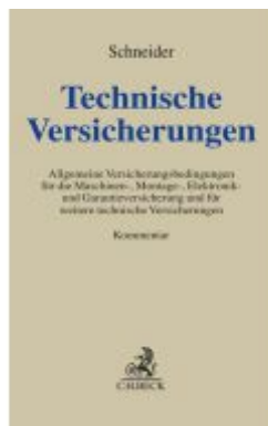
Technische Versicherungen Ladenpreis: 236,50EUR