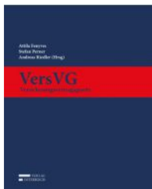
VersVG - Versicherungsvertragsgesetz Ladenpreis: 109,00EUR