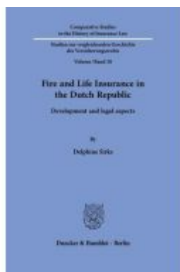
Fire and Life Insurance in the Dutch Republic. Ladenpreis: 102,70EUR