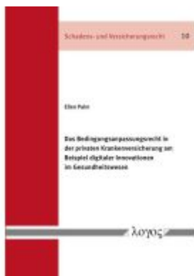
Das Bedingungsanpassungsrecht in der privaten Krankenversicherung am Beispiel digitaler Innovationen im Gesundheitswesen Ladenpreis: 41,10EUR