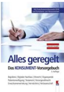
Alles geregelt. Das KONSUMENT-Vorsorgebuch Ladenpreis: 19,90 EUR