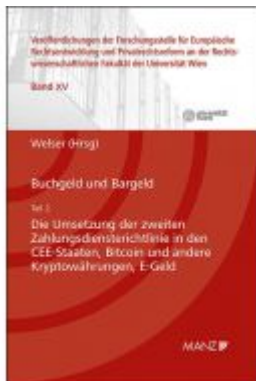
Buchgeld und Bargeld - Teil 2: Die Umsetzung der zweiten Zahlungsdienstrichtlinie in den CEE-Staaten Ladenpreis: 64,00 EUR