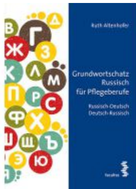
Grundwortschatz Russisch für Pflegeberufe Ladenpreis: 18,90 EUR