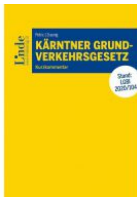
Kärntner Grundverkehrsgesetz Ladenpreis: 48,00 EUR