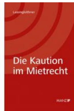
Die Kautio im Mietrecht Ladenpreis: 52,00 EUR