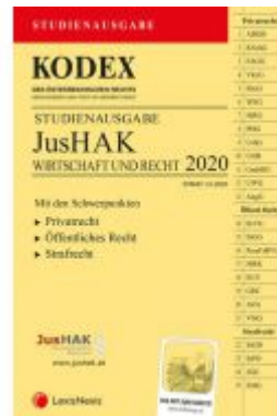
KODEX JusHAK Ladenpreis: 23,00 EUR