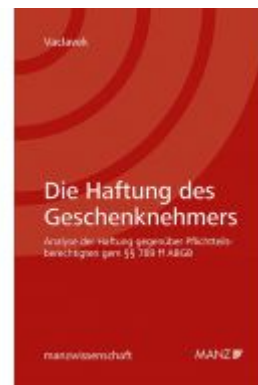
Die Haftung des Geschenknehmers gegenüber dem Pflichtteilsberechtigten Ladenpreis: 59,00 EUR