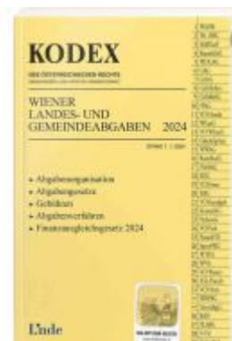
KODEX Wiener Landes- und Gemeindeabgaben Ladenpreis: 29,00EUR