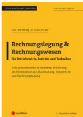
Rechnungslegung & Rechnungswesen für Betriebswirte, Juristen und Techniker Ladenpreis: 28,75EUR