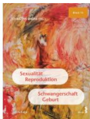
Sexualität, Reproduktion, Schwangerschaft, Geburt Ladenpreis: 29,50EUR