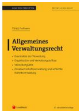
Allgemeines Verwaltungsrecht (Skriptum) Ladenpreis: 26,25EUR