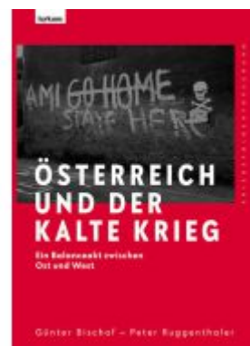
Österreich und der Kalte Krieg Ladenpreis: 39,00EUR