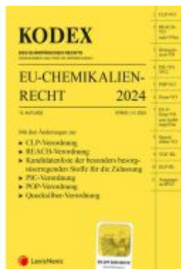
KODEX EU-Chemikalienrecht 2024 - inkl. App Ladenpreis: 99,00EUR

Wir haben andere Produkte gefunden, die Ihnen gefallen könnten!