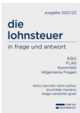
die lohnsteuer in frage und antwort Ladenpreis: 108,00EUR