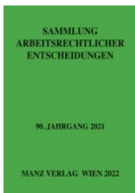
Sammlung arbeitsrechtlicher Entscheidungen Ladenpreis: 98,00EUR