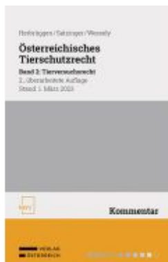
Österreichisches Tierschutzrecht Ladenpreis: 88,00EUR