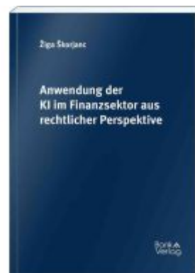
Anwendung der KI im Finanzsektor aus rechtlicher Perspektive Ladenpreis: 69,00EUR