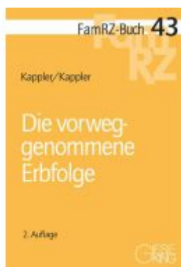
Die vorweggenommene Erbfolge Ladenpreis: 71,00EUR