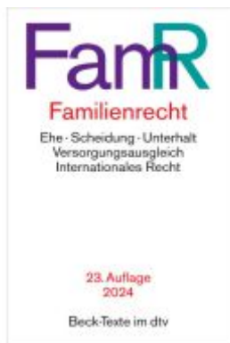
Familienrecht Ladenpreis: 19,50EUR