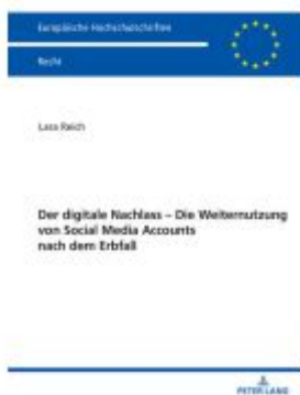
Der digitale Nachlass Ladenpreis: 56,50EUR