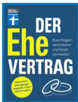
Der Ehevertrag Ladenpreis: 23,60EUR