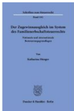
Der Zugewinnausgleich im System des Familienerbschaftsteuerrechts. Ladenpreis: 113,00EUR