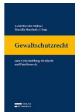
Gewaltschutzrecht Ladenpreis: 89,00EUR