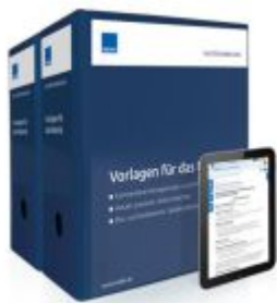
Vorlagen für das Notariat Ladenpreis: 261,80EUR

Wir haben andere Produkte gefunden, die Ihnen gefallen könnten!