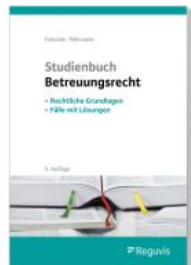
Studienbuch Betreuungsrecht Ladenpreis: 39,10EUR