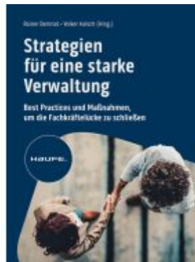
Strategien für eine starke Verwaltung Ladenpreis: 61,70EUR