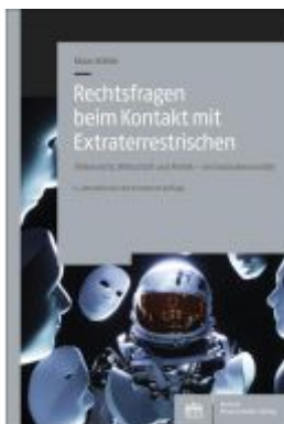
Rechtsfragen beim Kontakt mit Extraterrestrischen Ladenpreis: 40,10EUR