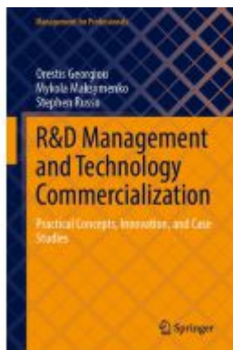
R&D Management and Technology Commercialization Ladenpreis: 109,99EUR