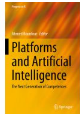
Platforms and Artificial Intelligence Ladenpreis: 142,99EUR