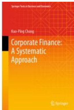
Corporate Finance: A Systematic Approach Ladenpreis: 164,99EUR

Wir haben andere Produkte gefunden, die Ihnen gefallen könnten!