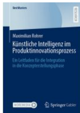
Künstliche Intelligenz im Produktinnovationsprozess Ladenpreis: 71,95EUR