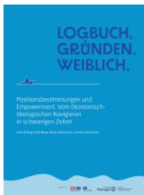
Logbuch. Gründen. Weiblich. Ladenpreis: 20,40EUR