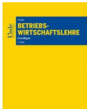
Betriebswirtschaftslehre Ladenpreis: 35,00EUR