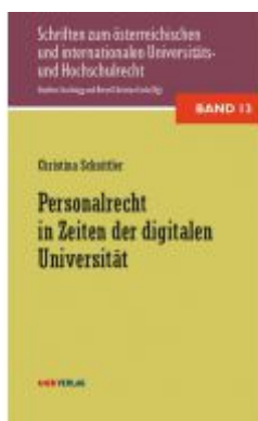
Personalrecht in Zeiten der digitalen Universität Ladenpreis: 36,00EUR