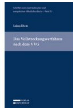
Das Vollstreckungsverfahren nach dem VVG Ladenpreis: 69,00EUR