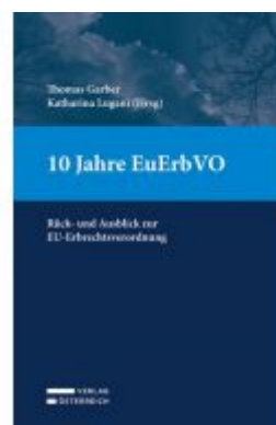
10 Jahre EuErbVO Ladenpreis: 89,00EUR