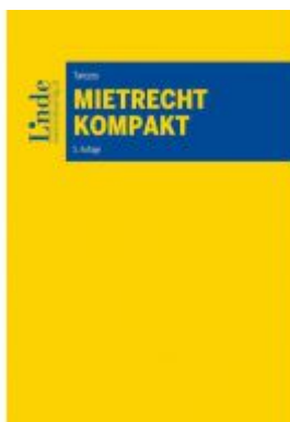
Mietrecht kompakt Ladenpreis: 46,00EUR