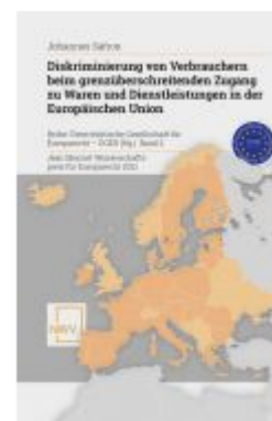
Diskriminierung von Verbrauchern beim grenzüberschreitenden Zugang zu Waren und Dienstleistungen in der Europäischen Union Ladenpreis: 88,00EUR