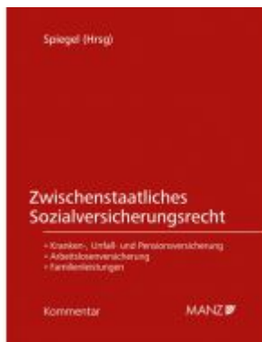
Zwischenstaatliches Sozialversicherungsrecht Ladenpreis: 219,00EUR