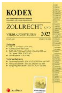
KODEX Zollrecht 2023 - inkl. App Ladenpreis: 119,00EUR