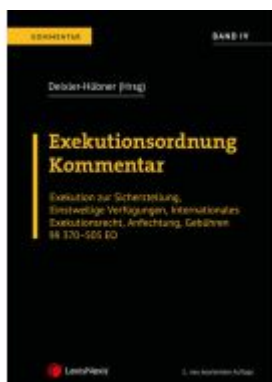
Exekutionsordnung - Kommentar Band 4 Ladenpreis: 164,00EUR