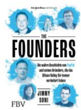
The Founders Ladenpreis: 22,70EUR