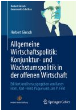
Allgemeine Wirtschaftspolitik: Konjunktur- und Wachstumspolitik in der offenen Wirtschaft Ladenpreis: 61,67EUR