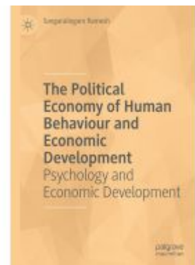
The Political Economy of Human Behaviour and Economic Development Ladenpreis: 109,99EUR