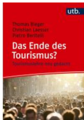
Das Ende des Tourismus? Ladenpreis: 29,80EUR