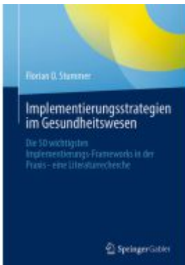
Implementierungsstrategien im Gesundheitswesen Ladenpreis: 39,06EUR

Wir haben andere Produkte gefunden, die Ihnen gefallen könnten!