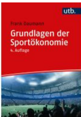
Grundlagen der Sportökonomie Ladenpreis: 39,00EUR