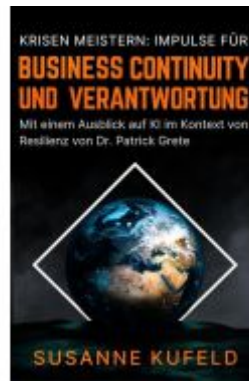
Krisen meistern: Impulse für Business Continuity und Verantwortung Ladenpreis: 28,80EUR