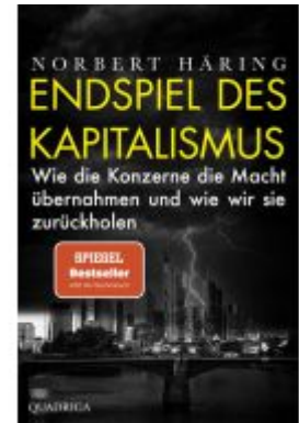
Endspiel des Kapitalismus Ladenpreis: 14,40EUR