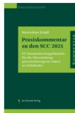
Praxiskommentar zu den SCC 2021 Ladenpreis: 128,00EUR