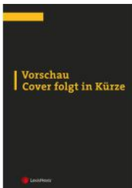
Zur Lage der Verfassungsgerichtsbarkeit in Österreich und in Europa Ladenpreis: 9,00EUR