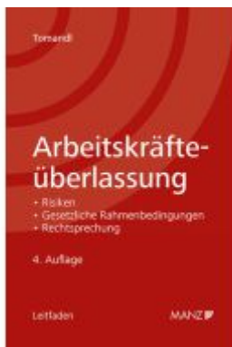
Arbeitskräfteüberlassung Ladenpreis: 46,00EUR