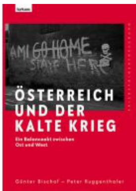
Österreich und der Kalte Krieg Ladenpreis: 39,00EUR