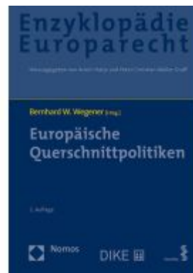
Europäische Querschnittpolitiken Ladenpreis: 174,80EUR