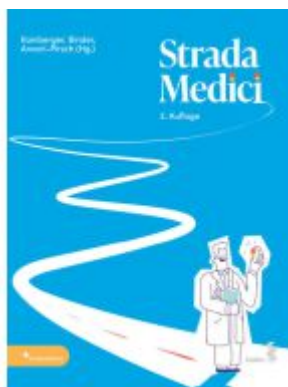
Strada Medici Ladenpreis: 38,00EUR