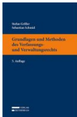
Grundlagen und Methoden des Verfassungs- und Verwaltungsrechts Ladenpreis: 32,00EUR