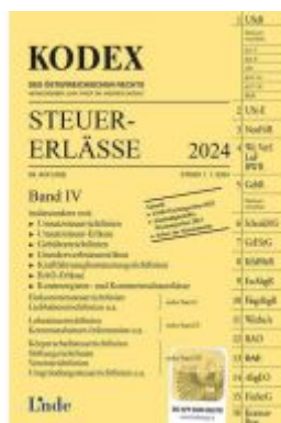
KODEX Steuer-Erlässe 2024, Band IV Ladenpreis: 66,00EUR