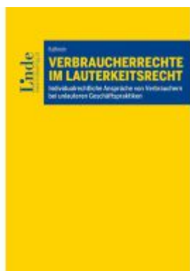
Verbraucherrechte im Lauterkeitsrecht Ladenpreis: 59,00EUR