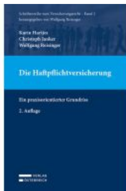
Die Haftpflichtversicherung Ladenpreis: 69,00EUR