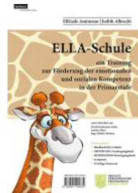
ELLA - Schule - ein Training zur Förderung der emotionalen und sozialen Kompetenz in der Primarstufe Ladenpreis: 42,00EUR