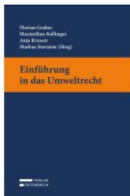
Einführung in das Umweltrecht Ladenpreis: 32,00EUR