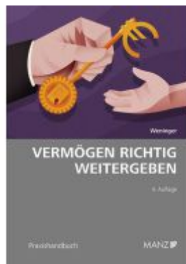
Vermögen richtig weitergeben Ladenpreis: 39,00EUR