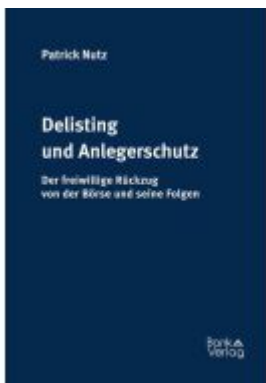
Delisting und Anlegerschutz Ladenpreis: 79,00EUR