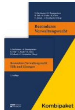
Kombipaket Besonderes Verwaltungsrecht: Lehrbuch & Fälle und Lösungen Ladenpreis: 78,00EUR