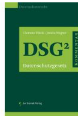
Praxiskommentar zum Datenschutzgesetz (DSG) Ladenpreis: 178,00EUR