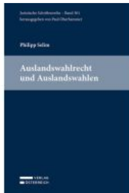
Auslandswahlrecht und Auslandswahlen Ladenpreis: 69,00EUR