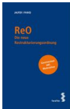
ReO Ladenpreis: 38,00EUR