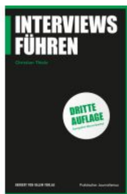
Interviews führen Ladenpreis: 22,70EUR