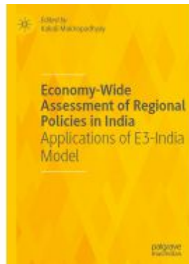
Economy-Wide Assessment of Regional Policies in India