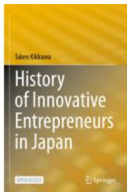
History of Innovative Entrepreneurs in Japan