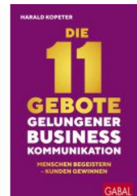
Die 11 Gebote gelungener Businesskommunikation