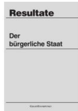
Der bürgerliche Staat