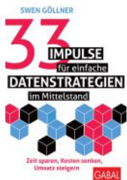
33 Impulse für einfache Datenstrategien im Mittelstand Ladenpreis: 28,80EUR