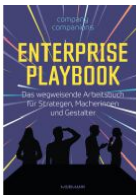
Enterprise Playbook Ladenpreis: 40,10EUR