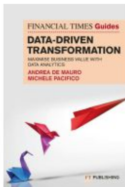
The Financial Times Guide to Data-Driven Transformation: How to drive substantial business value with data analytics Ladenpreis: 37,44EUR