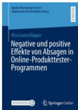
Negative und positive Effekte von Absagen in Online-Produkttester-Programmen Ladenpreis: 71,95EUR