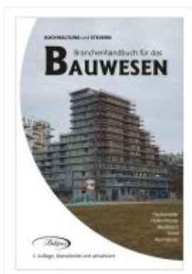
BAUWESEN Ladenpreis: 74,80EUR