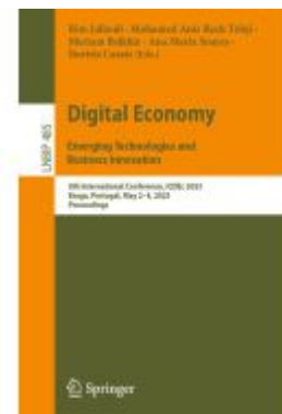
Digital Economy. Emerging Technologies and Business Innovation Ladenpreis: 81,39EUR