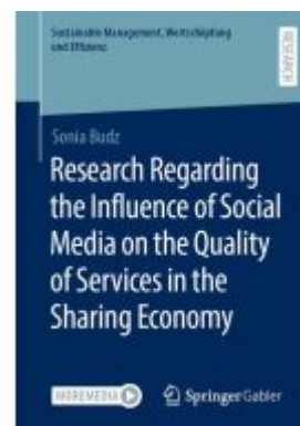
Research Regarding the Influence of Social Media on the Quality of Services in the Sharing Economy Ladenpreis: 109,99EUR