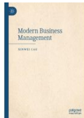
Modern Business Management Ladenpreis: 131,99EUR