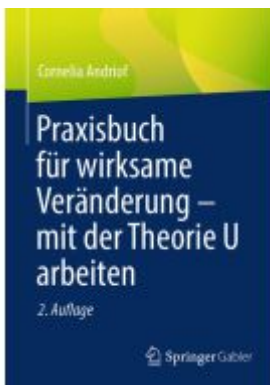
Praxisbuch für wirksame Veränderung – mit der Theorie U arbeiten Ladenpreis: 46,25EUR