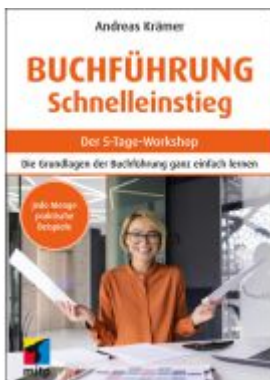
Buchführung Schnelleinstieg Ladenpreis: 17,50EUR

Wir haben andere Produkte gefunden, die Ihnen gefallen könnten!