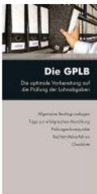
Die GPLB Ladenpreis: 14,30EUR