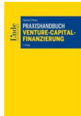
Praxishandbuch Venture-Capital- Finanzierung Ladenpreis: 59,00EUR