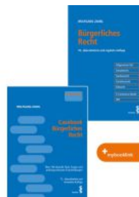
Kombipaket Casebook Bürgerliches Recht und Bürgerliches Recht Ladenpreis: 86,00EUR