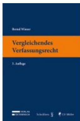
Vergleichendes Verfassungsrecht Ladenpreis: 55,00EUR