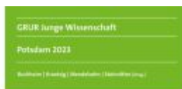
Plattformen Grundlagen und Neuedition des Rechts digitaler Plattformen