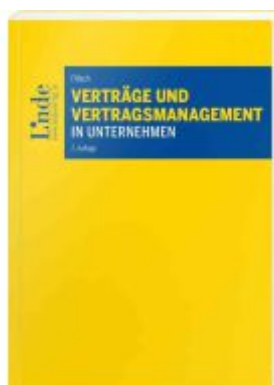
Verträge und Vertragsmanagement in Unternehmen Ladenpreis: 64,00EUR