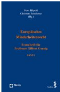
Europäisches Minderheitenrecht Ladenpreis: 162,00EUR

Wir haben andere Produkte gefunden, die Ihnen gefallen könnten!