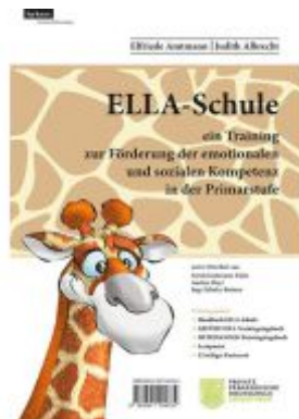
ELLA - Schule - ein Training zur Förderung der emotionalen und sozialen Kompetenz in der Primarstufe Ladenpreis: 42,00EUR