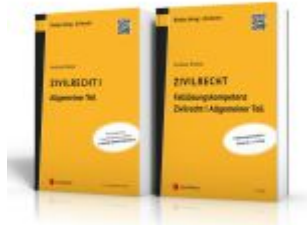
PAKET Zivilrecht I Allgemeiner Teil Ladenpreis: 64,00EUR