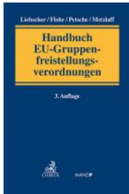
Handbuch der EU-Gruppenfreistellungsverordnung Ladenpreis: 179,00EUR