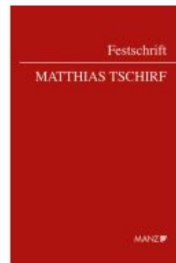
Festschrift Tschirf Ladenpreis: 64,00EUR