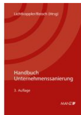
Handbuch Unternehmenssanierung Ladenpreis: 128,00EUR