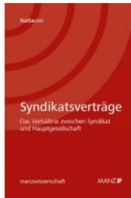
Syndikatsverträge - Das Verhältnis zwischen Syndikat und Hauptgesellschaft Ladenpreis: 64,00EUR