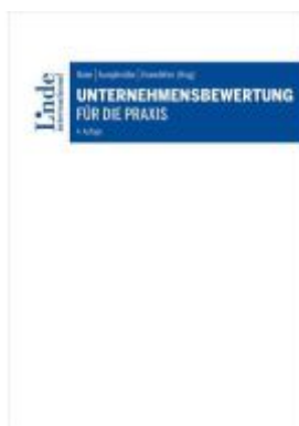
Unternehmensbewertung für die Praxis Ladenpreis: 109,00EUR