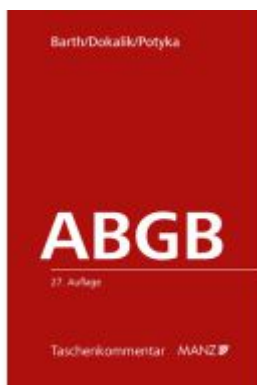
Das Allgemeine bürgerliche Gesetzbuch ABGB Ladenpreis: 134,00EUR