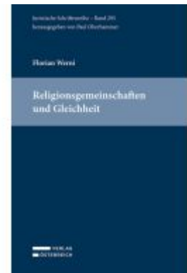
Religionsgemeinschaften und Gleichheit Ladenpreis: 145,00EUR