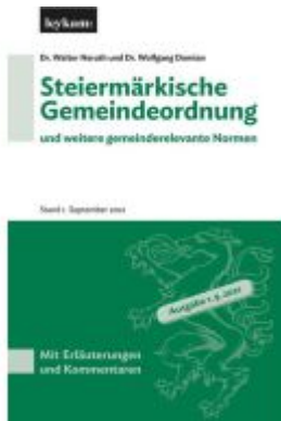
Steiermärkische Gemeindeordnung und weitere gemeinderelevante Normen Ladenpreis: 80,00EUR