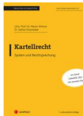
Kartellrecht (Skriptum) Ladenpreis: 27,50EUR