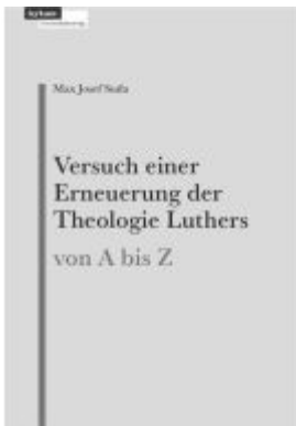
Versuch einer Erneuerung der Theologie Luthers Ladenpreis: 29,00EUR