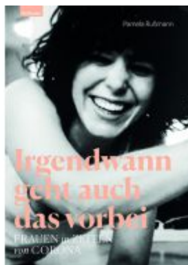
Irgendwann geht auch das vorbei Ladenpreis: 24,00EUR