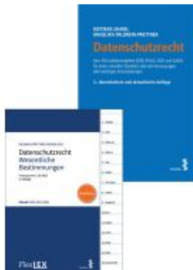
Kombipaket Datenschutzrecht und FlexLex Datenschutzrecht – Wesentliche Bestimmungen Ladenpreis: 38,00EUR