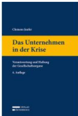
Das Unternehmen in der Krise Ladenpreis: 99,00EUR

Wir haben andere Produkte gefunden, die Ihnen gefallen könnten!