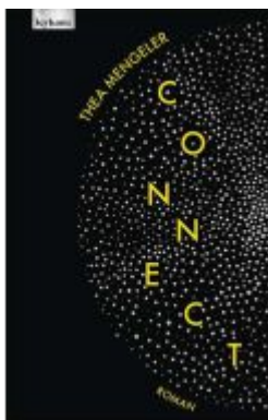
connect Ladenpreis: 24,00EUR