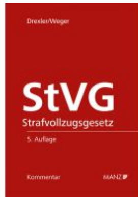
Strafvollzugsgesetz StVG Ladenpreis: 168,00EUR