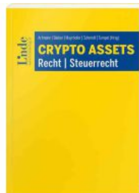
Crypto Assets Ladenpreis: 59,00EUR