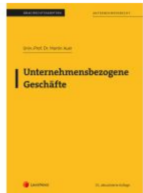
Unternehmensbezogene Geschäfte (Skriptum) Ladenpreis: 25,00EUR