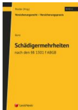
Schädigermehrheit nach den §§ 1301 f ABGB Ladenpreis: 69,00EUR