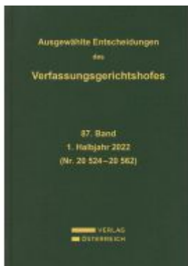
Ausgewählte Entscheidungen des Verfassungsgerichtshofes Ladenpreis: 459,00EUR