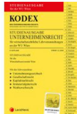
KODEX Unternehmensrecht für wirtschaftsrechtliche LVA 2024 - inkl. App Ladenpreis: 26,00EUR