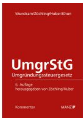
Umgründungssteuergesetz UmgrStG Ladenpreis: 178,00EUR