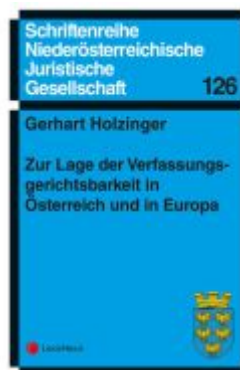
Zur Lage der Verfassungsgerichtsbarkeit in Österreich und in Europa Ladenpreis: 9,00EUR