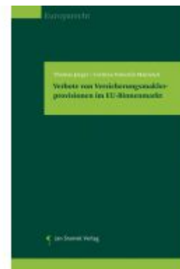
Verbote von Versicherungsmaklerprovisionen im EU-Binnenmarkt Ladenpreis: 49,90EUR