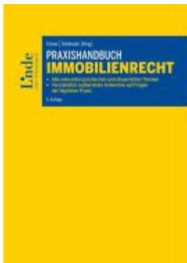
Praxishandbuch Immobilienrecht Ladenpreis: 120,00EUR

Wir haben andere Produkte gefunden, die Ihnen gefallen könnten!