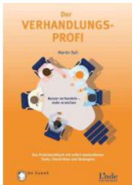
Der Verhandlungs-Profi Ladenpreis: 29,90EUR