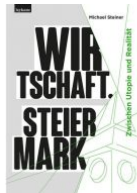
Wirtschaft. Steiermark Ladenpreis: 35,00 EUR