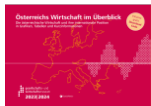
Österreichs Wirtschaft im Überblick 2023/24 Ladenpreis: 16,50EUR