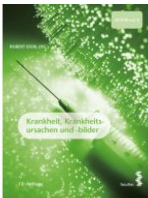
Krankheit, Krankheitsursachen und -bilder Ladenpreis: 34,90 EUR