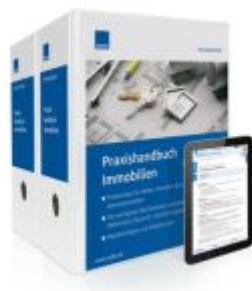
Praxishandbuch Immobilien Ladenpreis: 207,90 EUR