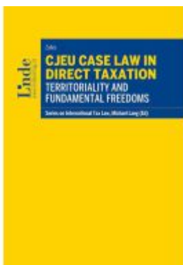
CJEU Case Law in Direct Taxation: Territoriality and Fundamental Freedoms Ladenpreis: 82,00EUR