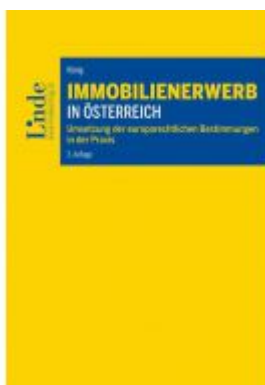
Immobilienwerb in Österreich Ladenpreis: 60,00 EUR