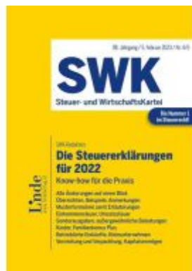
Die Steuererklärungen für 2022 Ladenpreis: 45,00EUR