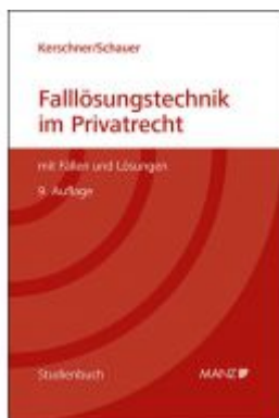
Falllösungstechnik im Privatrecht Mit Fällen und Lösungen Ladenpreis: 39,00 EUR