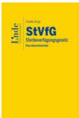
StVfG | Sterbeverfügungsgesetz Ladenpreis: 39,00EUR