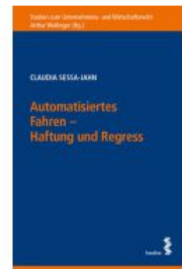
Automatisiertes Fahren – Haftung und Regress Ladenpreis: 52,00EUR