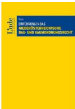
Einführung in das niederösterreichische Bau- und Raumordnungsrecht Ladenpreis: 56,00EUR