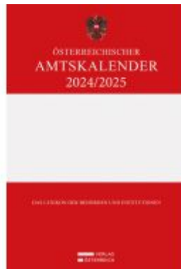
Österreichischer Amtskalender 2024/2025 Ladenpreis: 345,00EUR