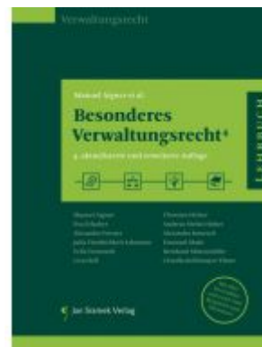
SET Fallbuch Öffentliches Recht und Besonderes Verwaltungsrecht 4. Auflage Ladenpreis: 78,00EUR