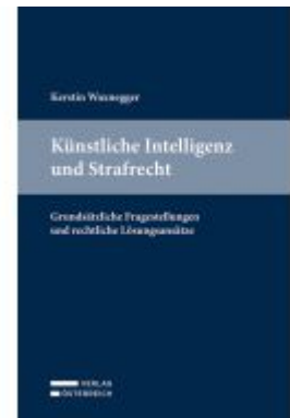
Künstliche Intelligenz und Strafrecht Ladenpreis: 89,00EUR