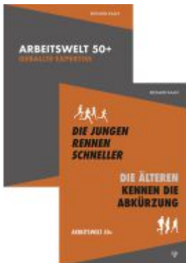
Arbeitswelt 50+: Band 1 und 2 im Set Ladenpreis: 49,50EUR

Wir haben andere Produkte gefunden, die Ihnen gefallen könnten!