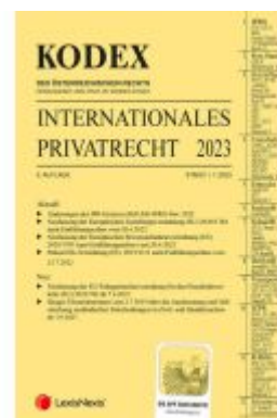
KODEX Internationales Privatrecht 2023 - inkl. App Ladenpreis: 37,00EUR