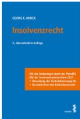
Insolvenzrecht Ladenpreis: 36,00EUR