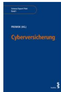
Cyberversicherung Ladenpreis: 36,00EUR