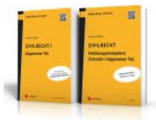
PAKET Zivilrecht I Allgemeiner Teil Ladenpreis: 64,00EUR