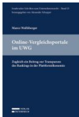
Online-Vergleichsportale im UWG Ladenpreis: 96,00EUR