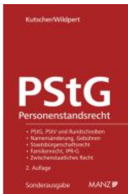
Das österreichische Personenstandsrecht Ladenpreis: 178,00EUR