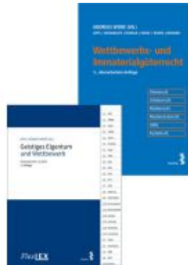
Kombipaket Wettbewerbs- und Immaterialgüterrecht und FlexLex Geistiges Eigentum und Wettbewerb Ladenpreis: 74,00EUR