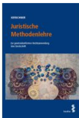
Juristische Methodenlehre Ladenpreis: 24,00EUR