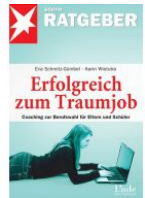
Erfolgreich zum Traumjob Ladenpreis: 10,20 EUR