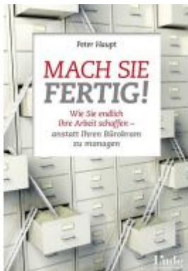
Mach sie fertig! Ladenpreis: 16,80 EUR

Wir haben andere Produkte gefunden, die Ihnen gefallen könnten!