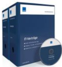
Mustersammlung IT-Verträge Ladenpreis: 228,90 EUR