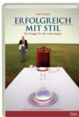
Erfolgreich mit Stil