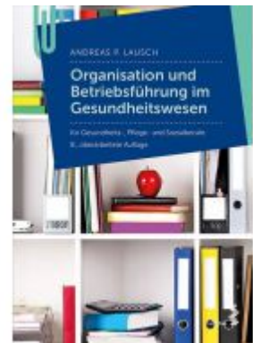
Organisation und Betriebsführung im Gesundheitswesen Ladenpreis: 24,90 EUR