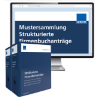
Mustersammlung Strukturierte Firmenbuchanträge Ladenpreis: 261,80EUR