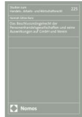
Das Beschlussmängelrecht der Personenhandelsgesellschaften und seine Auswirkungen auf GmbH und Verein Ladenpreis: 71,00EUR