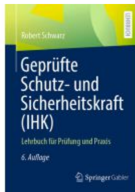
Geprüfte Schutz- und Sicherheitskraft (IHK) Ladenpreis: 20,55EUR