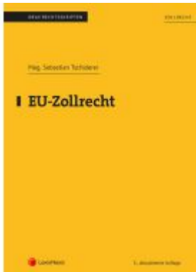
EU-Zollrecht (Skriptum) Ladenpreis: 43,75EUR

Wir haben andere Produkte gefunden, die Ihnen gefallen könnten!