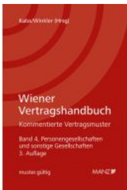
Wiener Vertragshandbuch Personen- und sonstige Gesellschaften Ladenpreis: 218,00EUR