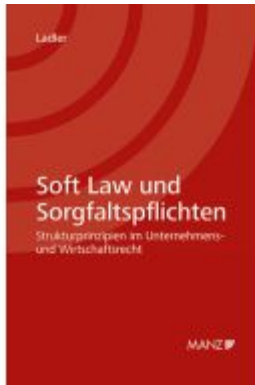
Soft Law und Sorgfaltspflichten Strukturprinzipien im Unternehmens- und Wirtschaftsrecht Ladenpreis: 98,00EUR