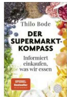
Der Supermarkt-Kompass Ladenpreis: 15,50EUR