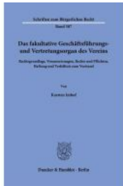
Das fakultative Geschäftsführungs- und Vertretungsorgan des Vereins Ladenpreis: 102,70EUR