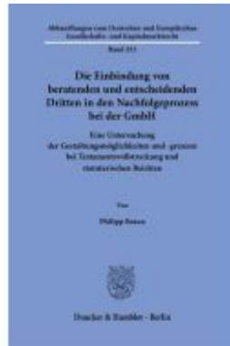
Die Einbindung von beratenden und entscheidenden Dritten in den Nachfolgeprozess bei der GmbH Ladenpreis: 92,50EUR