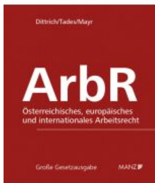
Arbeitsrecht Ladenpreis: 338,00EUR

Wir haben andere Produkte gefunden, die Ihnen gefallen könnten!