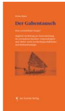
Der Gabentausch Ladenpreis: 24,90EUR