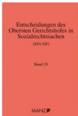
Entscheidungen des obersten Gerichtshofes in Sozialrechtssachen SSV- NF Ladenpreis: 143,90EUR