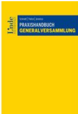
Praxishandbuch Generalversammlung Ladenpreis: 59,00EUR