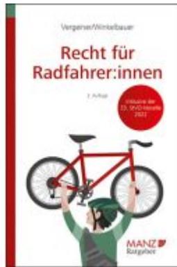
Recht für Radfahrer:innen Ladenpreis: 23,80EUR