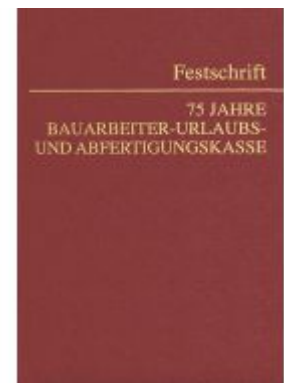
75 Jahre Bauarbeiter-Urlaubs- und Abfertigungskasse Ladenpreis: 59,00EUR