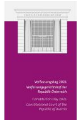
Verfassungstag 2021 Ladenpreis: 28,00EUR