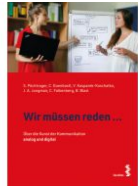
Wir müssen reden ... Ladenpreis: 9,90EUR