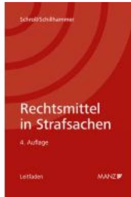
Rechtsmittel in Strafsachen Ladenpreis: 48,00EUR