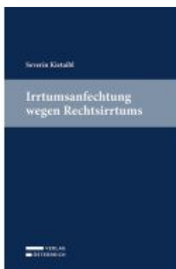
Irrtumsanfechtung wegen Rechtsirrtums Ladenpreis: 59,00EUR