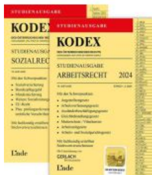
KODEX-Paket Studienausgabe Arbeits- und Sozialrecht 2024 Ladenpreis: 27,00EUR