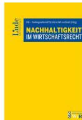
Nachhaltigkeit im Wirtschaftsrecht Ladenpreis: 69,00EUR