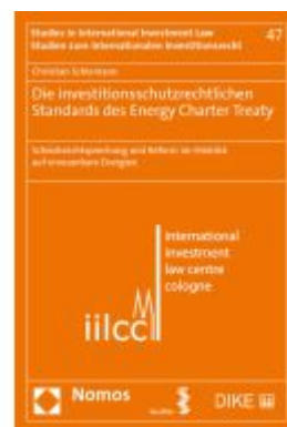
Die investitionsschutzrechtlichen Standards des Energy Charter Treaty Ladenpreis: 132,70EUR