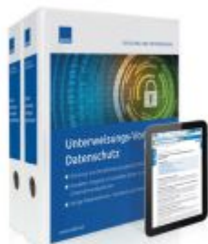
Unterweisungs-Vorlagen Datenschutz Ladenpreis: 239,80EUR

Wir haben andere Produkte gefunden, die Ihnen gefallen könnten!