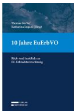
10 Jahre EuErbVO Ladenpreis: 89,00EUR