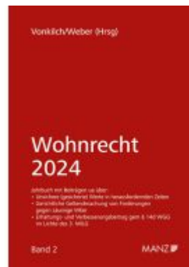
Wohnrecht 2024 Ladenpreis: 48,00EUR