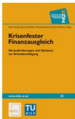
Krisenfester Finanzausgleich Ladenpreis: 44,80EUR