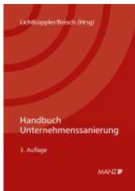
Handbuch Unternehmensanierung Ladenpreis: 128,00EUR