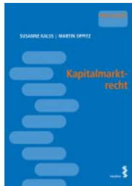
Kapitalmarktrecht Ladenpreis: 16,00EUR