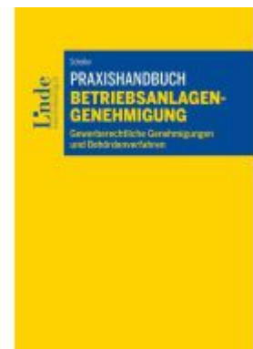
Praxishandbuch Betriebsanlagengenehmigung Ladenpreis: 39,00EUR