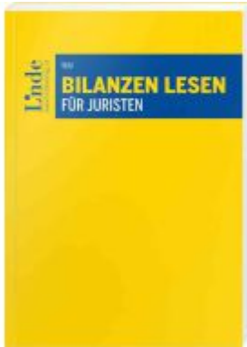
Bilanzen lesen für Juristen Ladenpreis: 56,00EUR