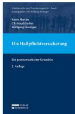
Die Haftpflichtversicherung Ladenpreis: 69,00EUR