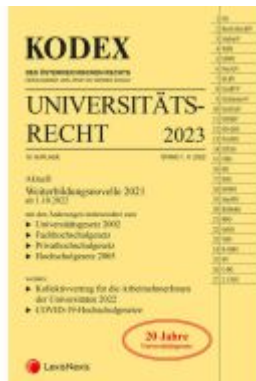
KODEX Universitätsrecht 2023 Ladenpreis: 62,00EUR