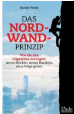
Das Nordwand-Prinzip Ladenpreis: 29,90EUR