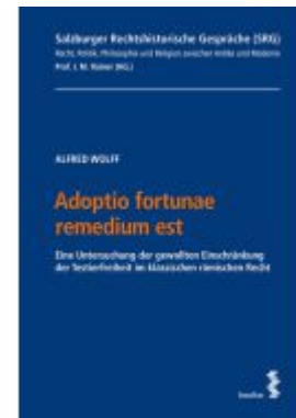
Adoptio fortunae remedium est Ladenpreis: 63,00EUR