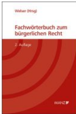
Fachwörterbuch zum bürgerlichen Recht Ladenpreis: 89,00EUR