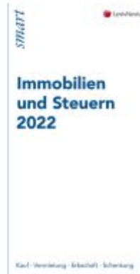
Immobilien und Steuern 2022 Ladenpreis: 12,00EUR