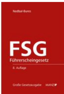
Führerscheingesetz Ladenpreis: 138,00EUR

Wir haben andere Produkte gefunden, die Ihnen gefallen könnten!