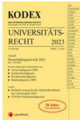
KODEX Universitätsrecht 2023 Ladenpreis: 62,00EUR