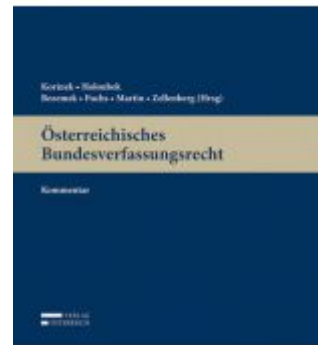
Österreichisches Bundesverfassungsrecht Ladenpreis: 439,00EUR