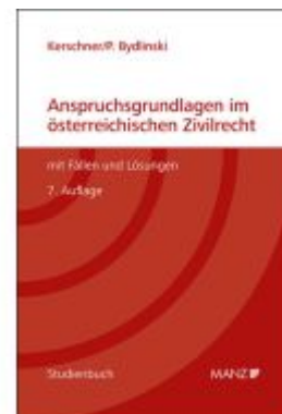
Anspruchsgrundlagen im österreichischen Zivilrecht mit Fällen und Lösungen Ladenpreis: 54,80EUR