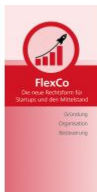
FlexCo Ladenpreis: 15,00EUR