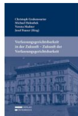
Verfassungsgerichtsbarkeit in der Zukunft - Zukunft der Verfassungsgerichtsbarkeit Ladenpreis: 69,00EUR