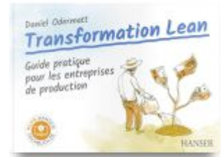
Transformation Lean Ladenpreis: 51,40EUR