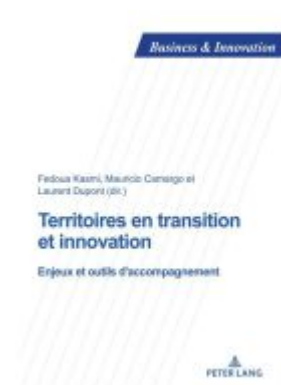
Territoires en transition et innovation Ladenpreis: 51,70EUR