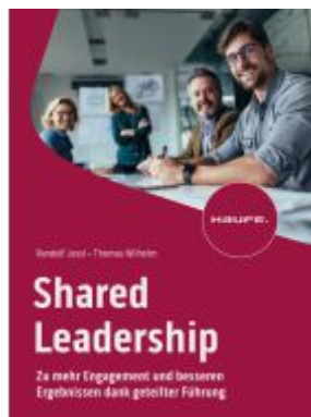
Shared Leadership Ladenpreis: 51,40EUR