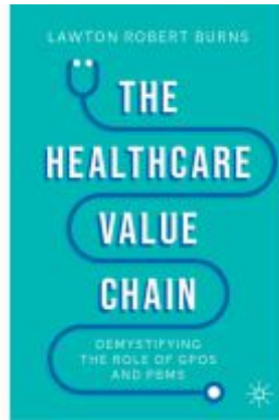
The Healthcare Value Chain Ladenpreis: 54,99EUR