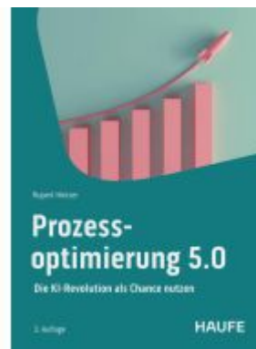
Prozessoptimierung 5.0 Ladenpreis: 46,30EUR