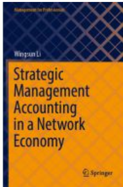
Strategic Management Accounting in a Network Economy Ladenpreis: 71,49EUR