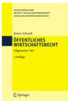
Öffentliches Wirtschaftsrecht Ladenpreis: 143,87EUR