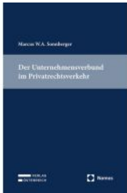
Der Unternehmensverbund im Privatrechtsverkehr Ladenpreis: 109,00EUR