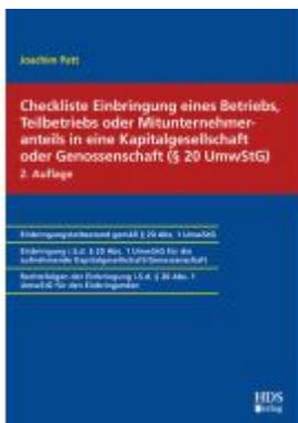
Checkliste Einbringung eines Betriebs, Teilbetriebs oder Mitunternehmeranteils in eine Kapitalgesellschaft oder Genossenschaft (§ 20 UmwStG) Ladenpreis: 51,30EUR

Wir haben andere Produkte gefunden, die Ihnen gefallen könnten!