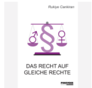
Das Recht auf gleiche Rechte Ladenpreis: 24,70EUR