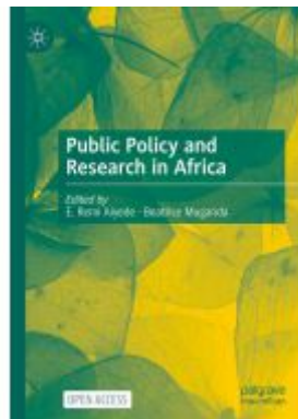
Public Policy and Research in Africa Ladenpreis: 54,99EUR