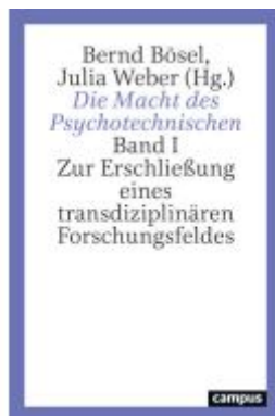
Die Macht des Psychotechnischen Ladenpreis: 46,60EUR