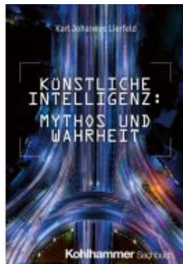
Künstliche Intelligenz: Mythos und Wahrheit Ladenpreis: 25,70EUR