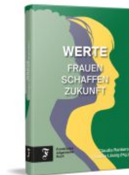
Werte Ladenpreis: 26,80EUR