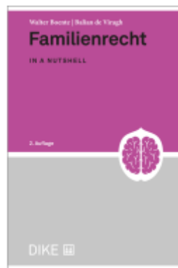
Familienrecht Ladenpreis: 57,00EUR