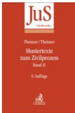
Mustertexte zum Zivilprozess Band II: Besondere Verfahren erster und zweiter Instanz, Relationstechnik Ladenpreis: 51,20EUR