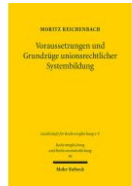
Voraussetzungen und Grundzüge unionsrechtlicher Systembildung Ladenpreis: 86,40EUR