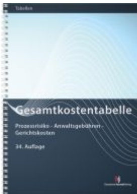
Gesamtkostentabelle Ladenpreis: 27,80EUR

Wir haben andere Produkte gefunden, die Ihnen gefallen könnten!