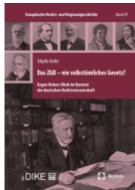
Das ZGB – ein volkstümliches Gesetz? Ladenpreis: 96,00EUR