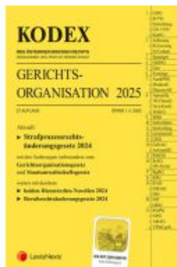
KODEX Gerichtsorganisation 2025 - inkl. App Ladenpreis: 82,00EUR