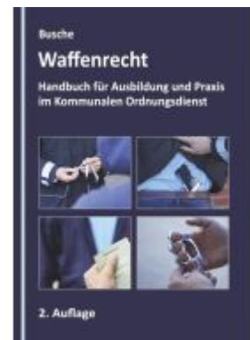
Waffenrecht - Grundlagen im Kommunalen Ordnungsdienst Ladenpreis: 22,70EUR