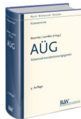
AÜG - Arbeitnehmerüberlassungsgesetz Ladenpreis: 153,20EUR