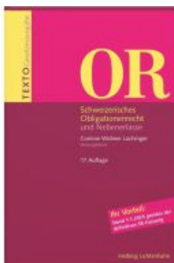
TEXTO OR Ladenpreis: 33,00EUR