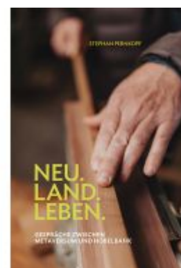
Neu.Land.Leben Ladenpreis: 25,00EUR