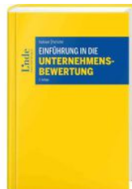
Einführung in die Unternehmensbewertung Ladenpreis: 85,00EUR