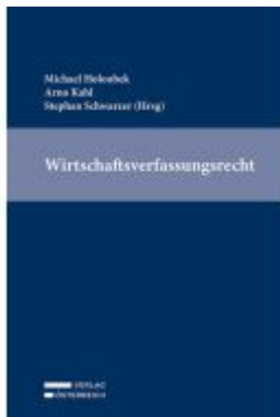
Wirtschaftsverfassungsrecht Ladenpreis: 169,00EUR

Wir haben andere Produkte gefunden, die Ihnen gefallen könnten!