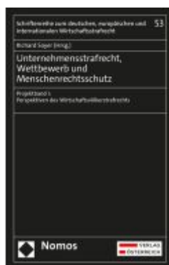
Unternehmensstrafrecht, Wettbewerb und Menschenrechtsschutz Ladenpreis: 249,00EUR