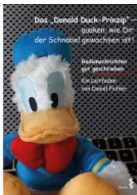
Das Donald Duck-Prinzip – quaken, wie Dir der Schnabel gewachsen ist! Ladenpreis: 13,40EUR