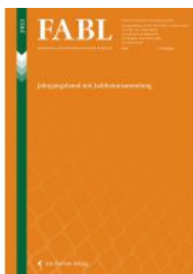
FABL Fremden- und Asylrechtliche Blätter Ladenpreis: 59,90EUR