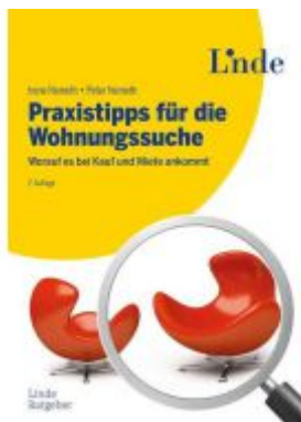
Praxistipps für die Wohnungssuche Ladenpreis: 29,90EUR