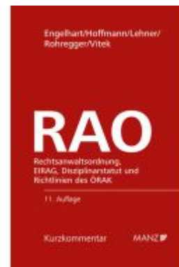
Rechtsanwaltsordnung RAO Ladenpreis: 210,00EUR