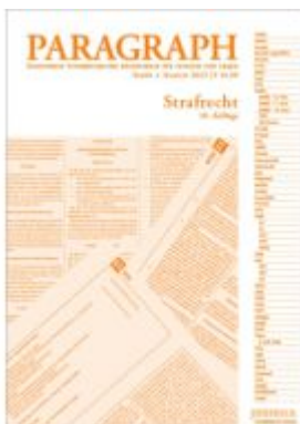
Paragraph - Strafrecht Ladenpreis: 16,90EUR

Wir haben andere Produkte gefunden, die Ihnen gefallen könnten!