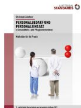
Personalbedarf und Personaleinsatz in Gesundheits- und Pflegeunternehmen Ladenpreis: 64,90EUR