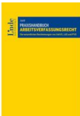
Praxishandbuch Arbeitsverfassungsrecht Ladenpreis: 79,00EUR