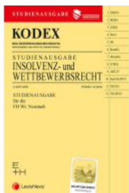
KODEX Insolvenz- und Wettbewerbsrecht 2022 - inkl. App Ladenpreis: 19,00EUR