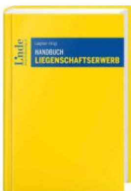
Handbuch Liegenschaftserwerb Ladenpreis: 49,00EUR