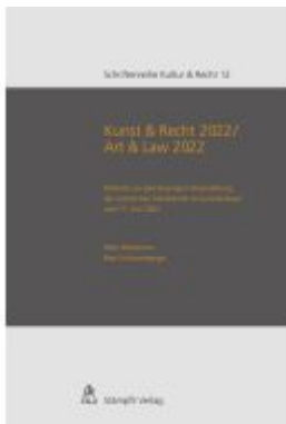
Kunst & Recht 2022 / Art & Law 2022 Ladenpreis: 80,00EUR

Wir haben andere Produkte gefunden, die Ihnen gefallen könnten!