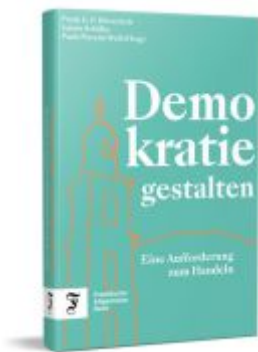
Demokratie gestalten Ladenpreis: 22,70EUR