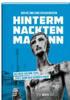
Hintern Nackten Mann Ladenpreis: 20,50EUR