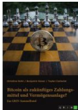
Bitcoin als zukünftiges Zahlungsmittel und Vermögensanlage? Herausforderungen und Chancen von Kryptowährungen Ladenpreis: 48,95EUR