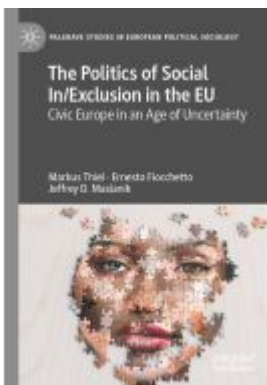
The Politics of Social In/Exclusion in the EU Ladenpreis: 153,99EUR