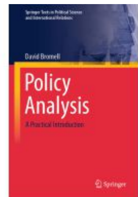
Policy Analysis Ladenpreis: 82,49EUR