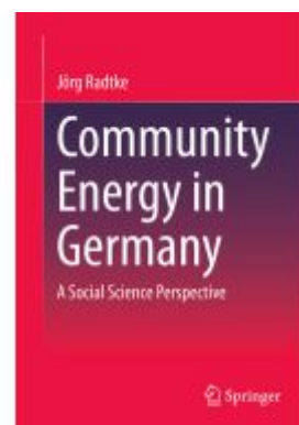
Community Energy in Germany Ladenpreis: 131,99EUR