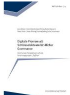
Digitale Pioniere als Schlüsselakteure ländlicher Governance Ladenpreis: 17,00EUR