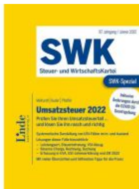
SWK-Spezial Umsatzsteuer 2022 Ladenpreis: 52,00EUR