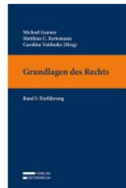
Grundlagen des Rechts Ladenpreis: 34,00EUR