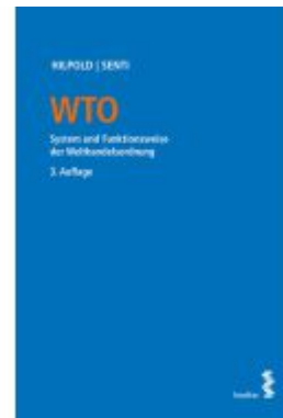
WTO Ladenpreis: 86,00EUR