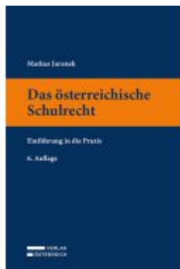
Das österreichische Schulrecht Ladenpreis: 49,00EUR