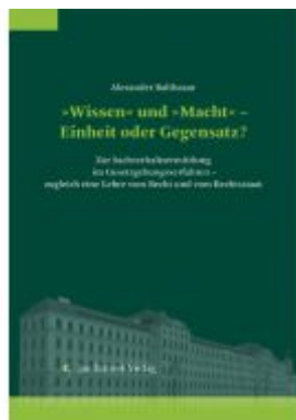
»Wissen« und »Macht« – Einheit oder Gegensatz? Ladenpreis: 198,00EUR