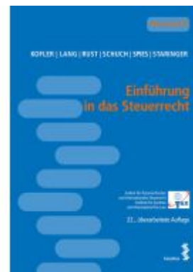
Einführung in das Steuerrecht Ladenpreis: 24,00EUR