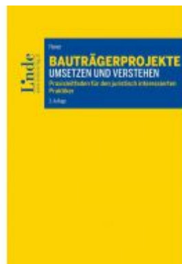
Bauträgerprojekte umsetzen und verstehen Ladenpreis: 52,00 EUR