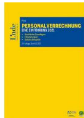
Personalverrechnung: eine Einführung 2021 Ladenpreis: 38,00 EUR