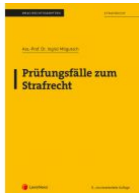
Strafrecht - Prüfungsfälle zum Strafrecht (Skriptum) Ladenpreis: 15,00 EUR