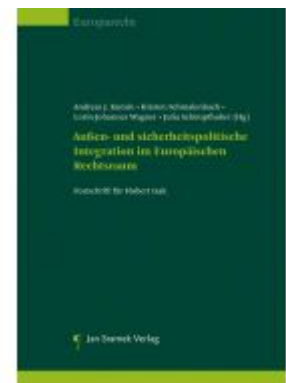
Außen- und sicherheitspolitische Integration im Europäischen Rechtsraum Ladenpreis: 128,00 EUR