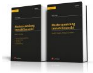
PAKET: Mustersammlung Immobilienrecht Ladenpreis: 79,20 EUR