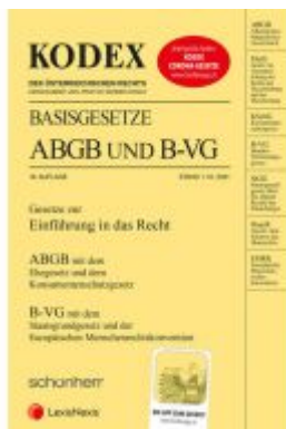
KODEX Basisgesetze ABGB und B-VG 2021/22 - inkl. App Ladenpreis: 15,00 EUR