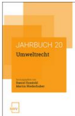
Umweltrecht Ladenpreis: 54,80 EUR

Wir haben andere Produkte gefunden, die Ihnen gefallen könnten!