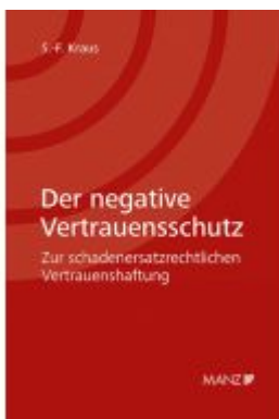
Der negative Vertrauensschutz Ladenpreis: 138,00 EUR