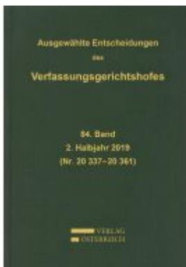
Ausgewählte Entscheidungen des Verfassungsgerichtshofes Ladenpreis: 299,00 EUR