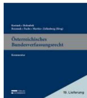
Österreichisches Bundesverfassungsrecht Ladenpreis: 529,00EUR