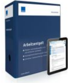
Arbeitsentgelt Ladenpreis: 239,80EUR

Alle Preise inkl. MwSt. zzgl. Versand. Bei Bestellung im LexisNexis Onlineshop kostenloser Versand innerhalb Österreichs.