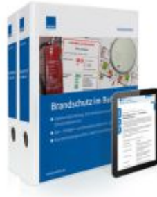
Brandschutz im Betrieb Ladenpreis: 239,80EUR