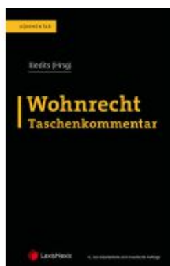
Wohnrecht Taschenkommentar Ladenpreis: 229,00EUR