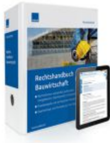
Rechtshandbuch Bauwirtschaft Ladenpreis: 239,80EUR