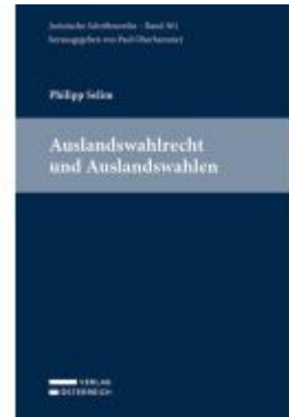
Auslandswahlrecht und Auslandswahlen Ladenpreis: 69,00EUR