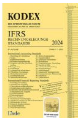
KODEX IFRS - Rechnungslegungsstandards 2024 Ladenpreis: 34,00EUR