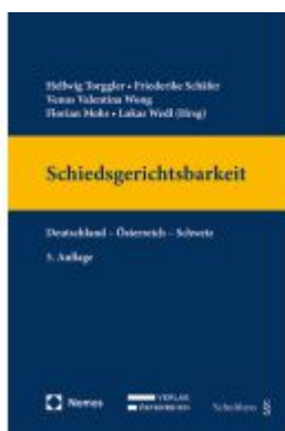
Schiedsgerichtsbarkeit Ladenpreis: 198,00EUR