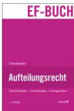
Aufteilungsrecht Ladenpreis: 128,00EUR