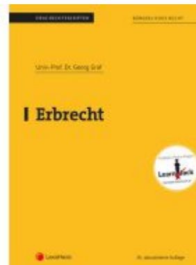
Erbrecht (Skriptum) Ladenpreis: 30,00EUR