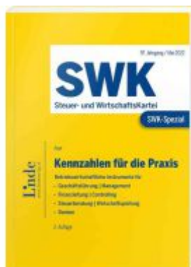
SWK-Spezial Kennzahlen für die Praxis Ladenpreis: 49,00EUR