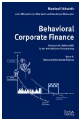
Behavioral Corporate Finance - Grenzen der Rationalität in der Betrieblichen Finanzierung Ladenpreis: 74,00EUR