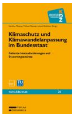
Klimaschutz und Klimawandelanpassung im Bundesstaat Ladenpreis: 52,00EUR