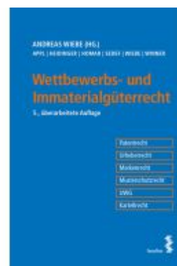
Wettbewerbs- und Immaterialgüterrecht Ladenpreis: 51,00EUR