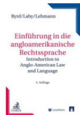
Einführung in die anglo-amerikanische Rechtssprache Ladenpreis: 39,00 EUR