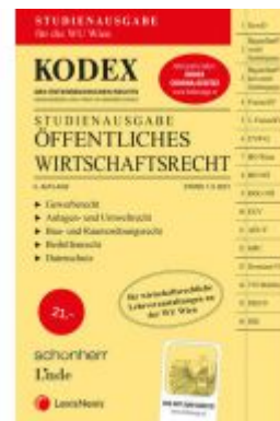
KODEX Öffentliches Wirtschaftsrecht 2021/22 - inkl. App Ladenpreis: 21,00 EUR