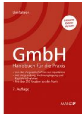
GmbH - Handbuch für die Praxis Ladenpreis: 278,00 EUR