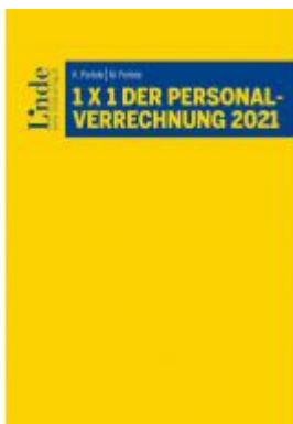
1 x 1 der Personalverrechnung 2021 Ladenpreis: 36,00 EUR