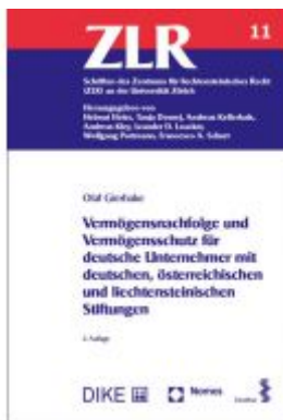
Vermögensnachfolge und Vermögensschutz für deutsche Unternehmer mit deutschen, österreichischen und liechtensteinischen Stiftungen Ladenpreis: 88,40 EUR