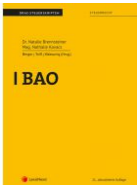
BAO Ladenpreis: 18,00 EUR

Wir haben andere Produkte gefunden, die Ihnen gefallen könnten!