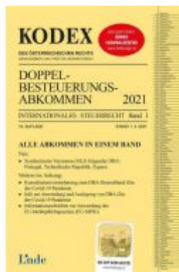
KODEX Doppelbesteuerungsabkommen 2021 Ladenpreis: 65,00 EUR