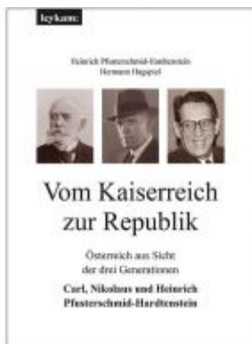
Vom Kaiserreich zur Republik Ladenpreis: 49,00 EUR