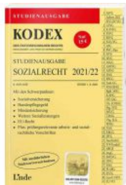
KODEX Studienausgabe Sozialrecht 2021/22 Ladenpreis: 15,00 EUR