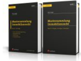
PAKET: Mustersammlung Immobilienrecht Ladenpreis: 88,80EUR