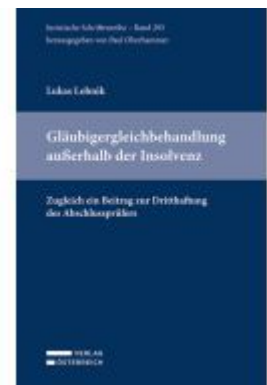
Gläubigergleichbehandlung außerhalb der Insolvenz Ladenpreis: 79,00EUR