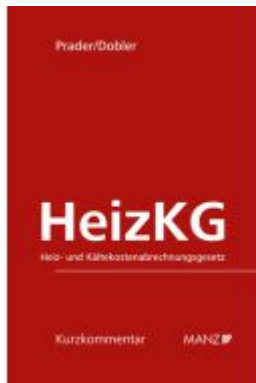
HeizKG Heiz- und Kältekostenabrechnungsgesetz Ladenpreis: 54,00EUR

Wir haben andere Produkte gefunden, die Ihnen gefallen könnten!