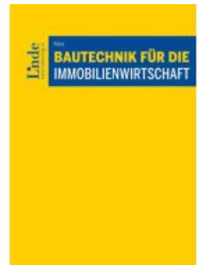
Bautechnik für die Immobilienwirtschaft Ladenpreis: 96,00EUR