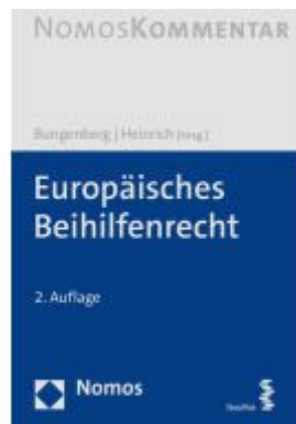
Europäisches Beihilfenrecht Ladenpreis: 256,00EUR