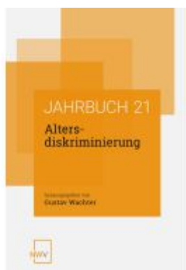
Altersdiskriminierung Ladenpreis: 64,00EUR