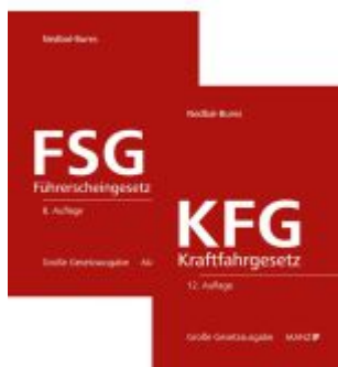
PAKET: Kraftfahrgesetz 12. Aufl + Führerscheingesetz 8. Aufl Ladenpreis: 220,00EUR