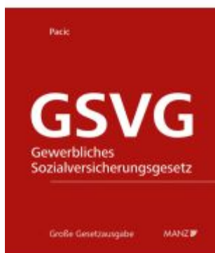
Die Sozialversicherung der in der gewerblichen Wirtschaft selbständig Erwerbstätigen - GSVG Ladenpreis: 298,00EUR