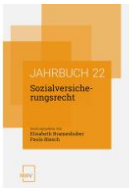
Sozialversicherungsrecht Ladenpreis: 68,00EUR