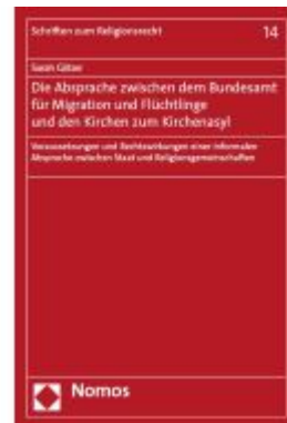
Die Absprache zwischen dem Bundesamt für Migration und Flüchtlinge und den Kirchen zum Kirchenasyl Ladenpreis: 117,20EUR