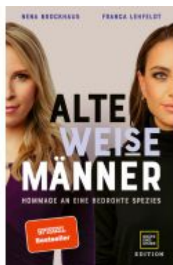
Alte WEISE Männer