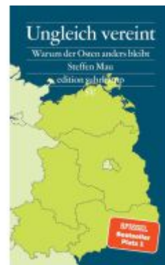
Ungleich vereint Ladenpreis: 18,50EUR