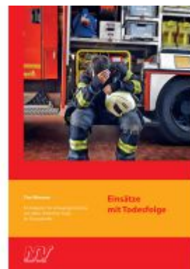
Einsätze mit Todesfolge