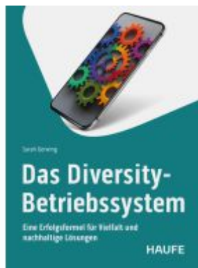
Das Diversity-Betriebssystem Ladenpreis: 30,90EUR