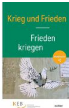
Krieg und Frieden Ladenpreis: 15,40EUR