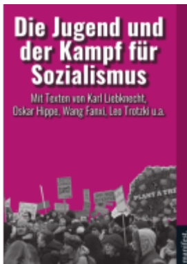
Die Jugend und der Kampf für Sozialismus Ladenpreis: 12,00EUR

Wir haben andere Produkte gefunden, die Ihnen gefallen könnten!