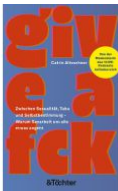
Give a Fck