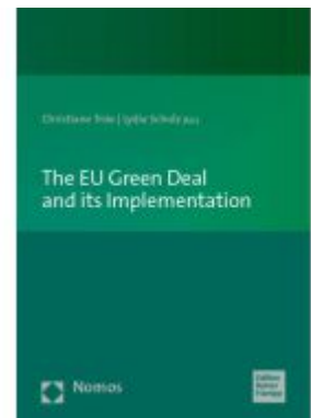
The EU Green Deal and its Implementation Ladenpreis: 71,00EUR