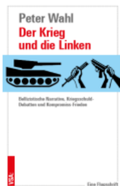
Der Krieg und die Linken