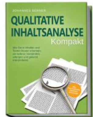
Qualitative Inhaltsanalyse - Kompakt: Wie Sie in Inhalten und Texten Muster erkennen, ein tieferes Verständnis erlangen und gekonnt interpretieren - inkl. Praxisbeispiel Experteninterviews Ladenpreis: 15,90EUR