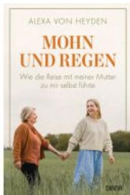
Mohn und Regen Ladenpreis: 18,50EUR