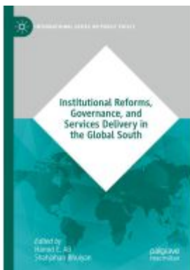
Institutional Reforms, Governance, and Services Delivery in the Global South