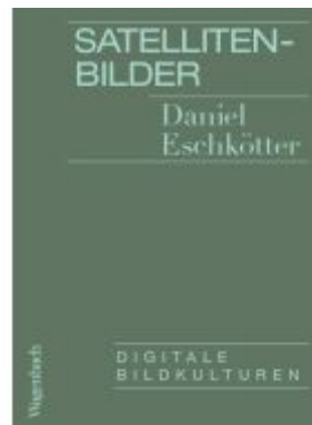
Satellitenbilder Ladenpreis: 12,40EUR