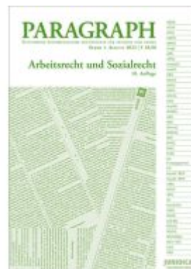
Paragraph - Arbeitsrecht und Sozialrecht Ladenpreis: 18,90EUR