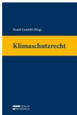
Klimaschutzrecht Ladenpreis: 129,00EUR