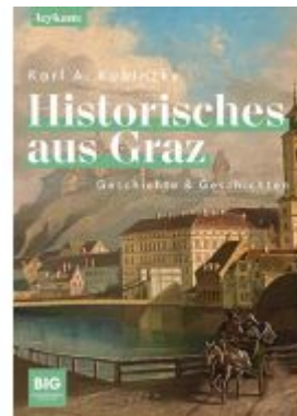
Historisches aus Graz Ladenpreis: 28,00EUR