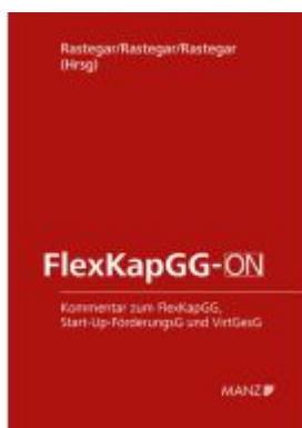
FlexKapGG-ON Ladenpreis: 138,00EUR