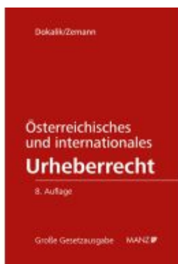
Österreichisches und internationales Urheberrecht Ladenpreis: 328,00EUR