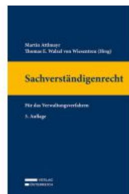
Sachverständigenrecht Ladenpreis: 149,00EUR