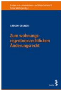
Zum wohnungseigentumsrechtlichen Änderungsrecht Ladenpreis: 66,00EUR