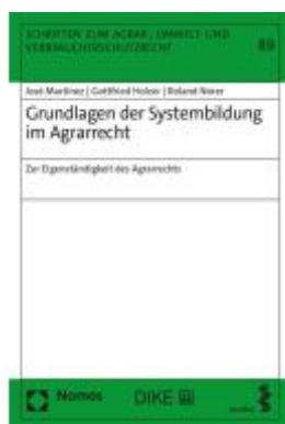
Grundlagen der Systembildung im Agrarrecht Ladenpreis: 74,10EUR