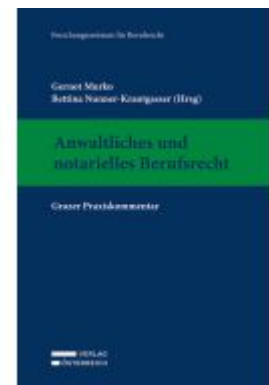
Anwaltliches und notarielles Berufsrecht Ladenpreis: 389,00EUR