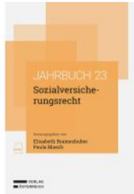
Sozialversicherungsrecht Ladenpreis: 68,00EUR