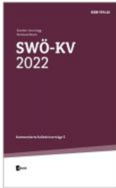
SWÖ-KV 2022 Ladenpreis: 36,00EUR