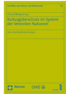
Kulturgüterschutz im System der Vereinten Nationen Ladenpreis: 56,60EUR