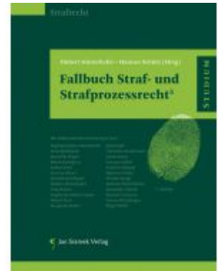
Fallbuch Straf- und Strafprozessrecht 5 Ladenpreis: 44,90EUR