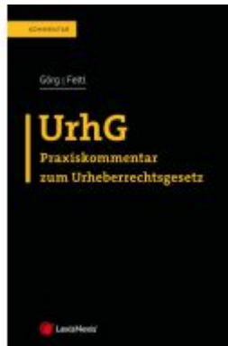
UrhG Ladenpreis: 124,00EUR