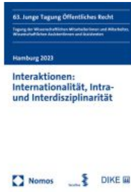
Interaktionen: Internationalität, Intra- und Interdisziplinarität Ladenpreis: 81,30EUR