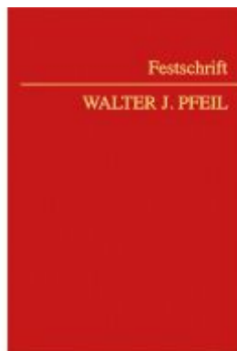
Festschrift Pfeil Ladenpreis: 168,00EUR