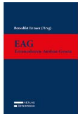
EAG - Erneuerbaren-Ausbau-Gesetz Ladenpreis: 89,00EUR