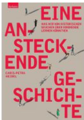
Eine ansteckende Geschichte Ladenpreis: 25,50EUR