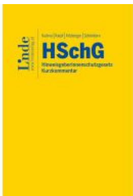
HSchG | HinweisgeberInnenschutzgesetz