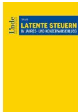
Latente Steuern im Jahres- und Konzernabschluss Ladenpreis: 66,00EUR