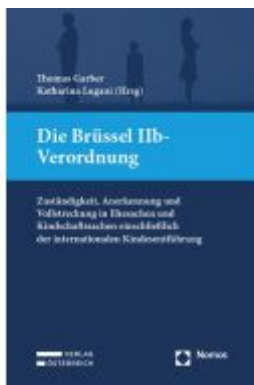
Die Brüssel IIb-Verordnung