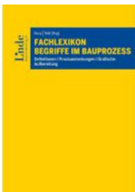
Fachlexikon Begriffe im Bauprozess