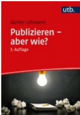
Publizieren – aber wie? Ladenpreis: 27,70EUR

Wir haben andere Produkte gefunden, die Ihnen gefallen könnten!