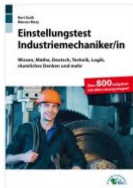
Einstellungstest Industriemechaniker Ladenpreis: 19,50EUR