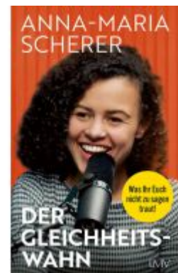
Der Gleichheitswahn Ladenpreis: 20,60EUR