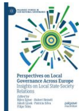
Perspectives on Local Governance Across Europe Ladenpreis: 142,99EUR