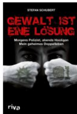
Gewalt ist eine Lösung Ladenpreis: 15,50EUR