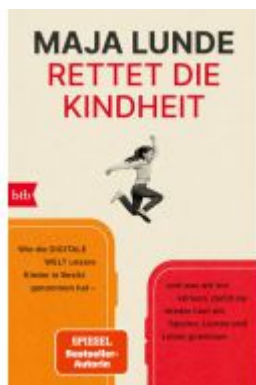
Rettet die Kindheit Ladenpreis: 18,50EUR