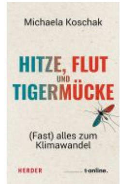
Hitze, Flut und Tigermücke Ladenpreis: 20,60EUR