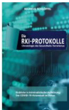
Die RKI-Protokolle Ladenpreis: 18,50EUR