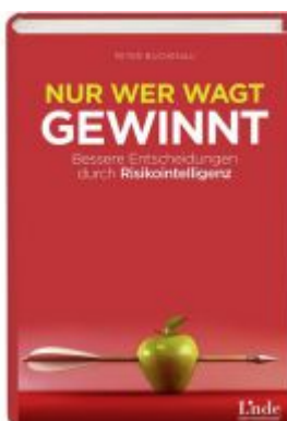
Nur wer wagt, gewinnt Ladenpreis: 24,90 EUR