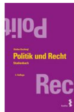
Politik und Recht Ladenpreis: 17,90 EUR