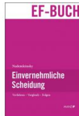
Einvernehmliche Scheidung Ladenpreis: 69,00 EUR