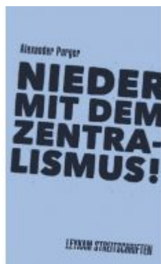
Nieder mit dem Zentralismus! Ladenpreis: 7,50 EUR