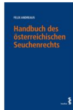
Handbuch des österreichischen Seuchenrechts Ladenpreis: 96,00 EUR