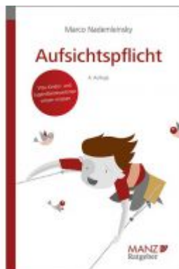
Aufsichtspflicht Ladenpreis: 21,80 EUR

Wir haben andere Produkte gefunden, die Ihnen gefallen könnten!