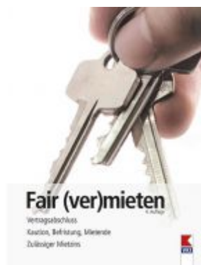
Fair (ver)mieten Ladenpreis: 19,90 EUR