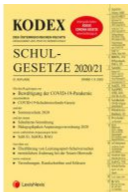
KODEX Schulgesetze 2020/21 Ladenpreis: 71,00 EUR