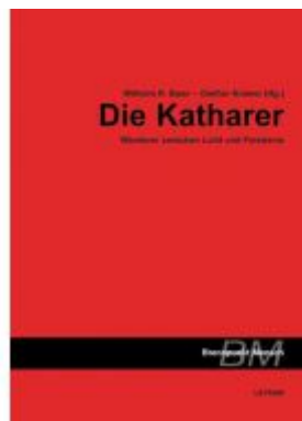
Die Katharer Ladenpreis: 14,90 EUR